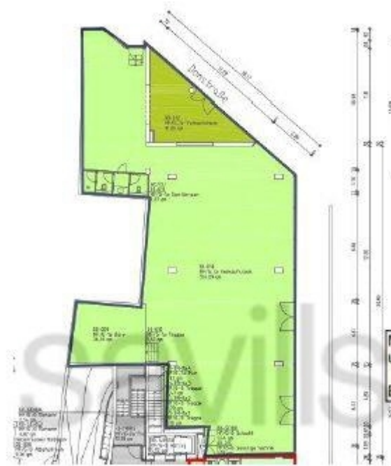
Grundriss Retail Erdgeschoss, ca 405 m 2