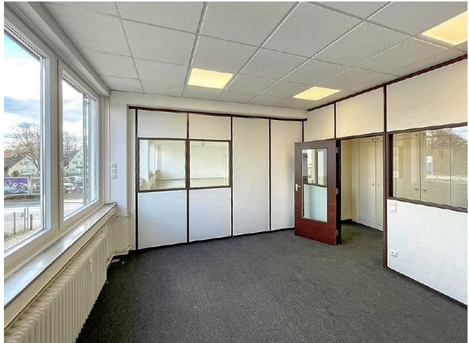
Innenaufnahme 1 OG