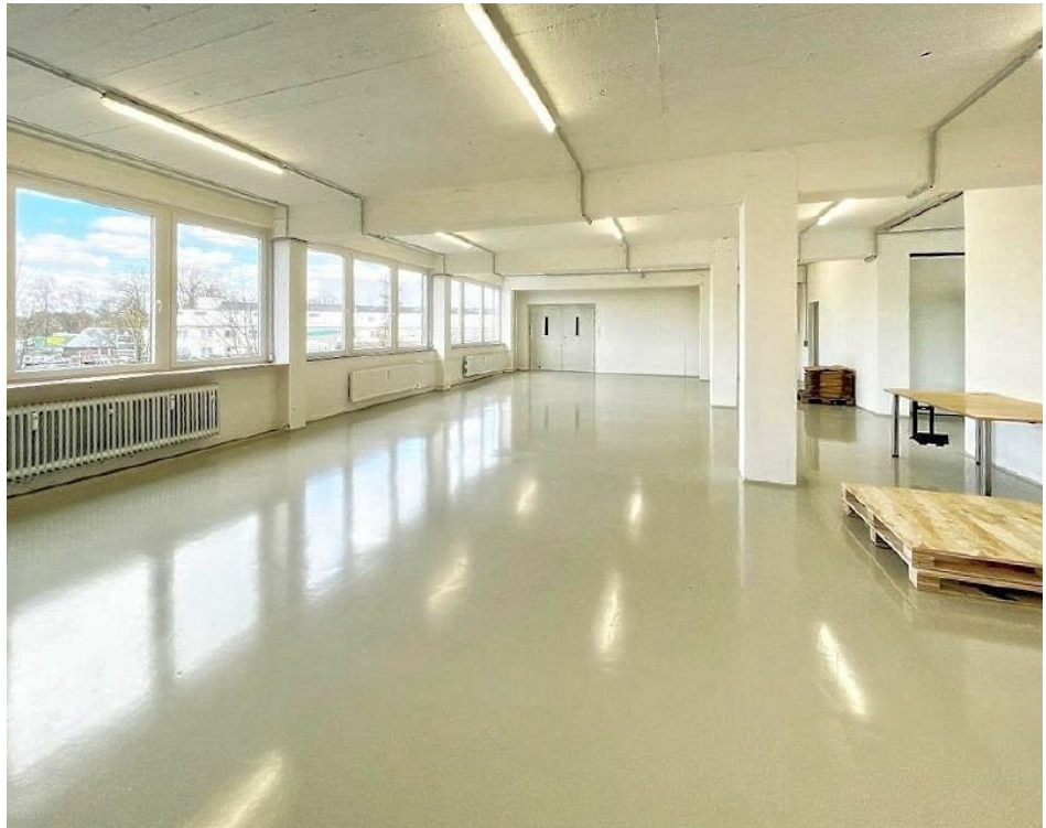
Innenaufnahme 1 OG