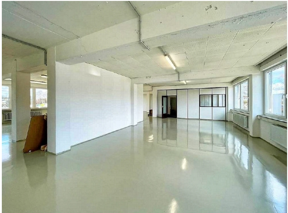
Innenaufnahme 1 OG