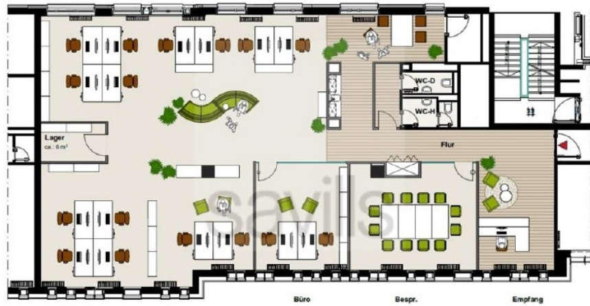
Überseeallee 3, 2 Obergeschoss, ca 310 m 2 - Variante 2