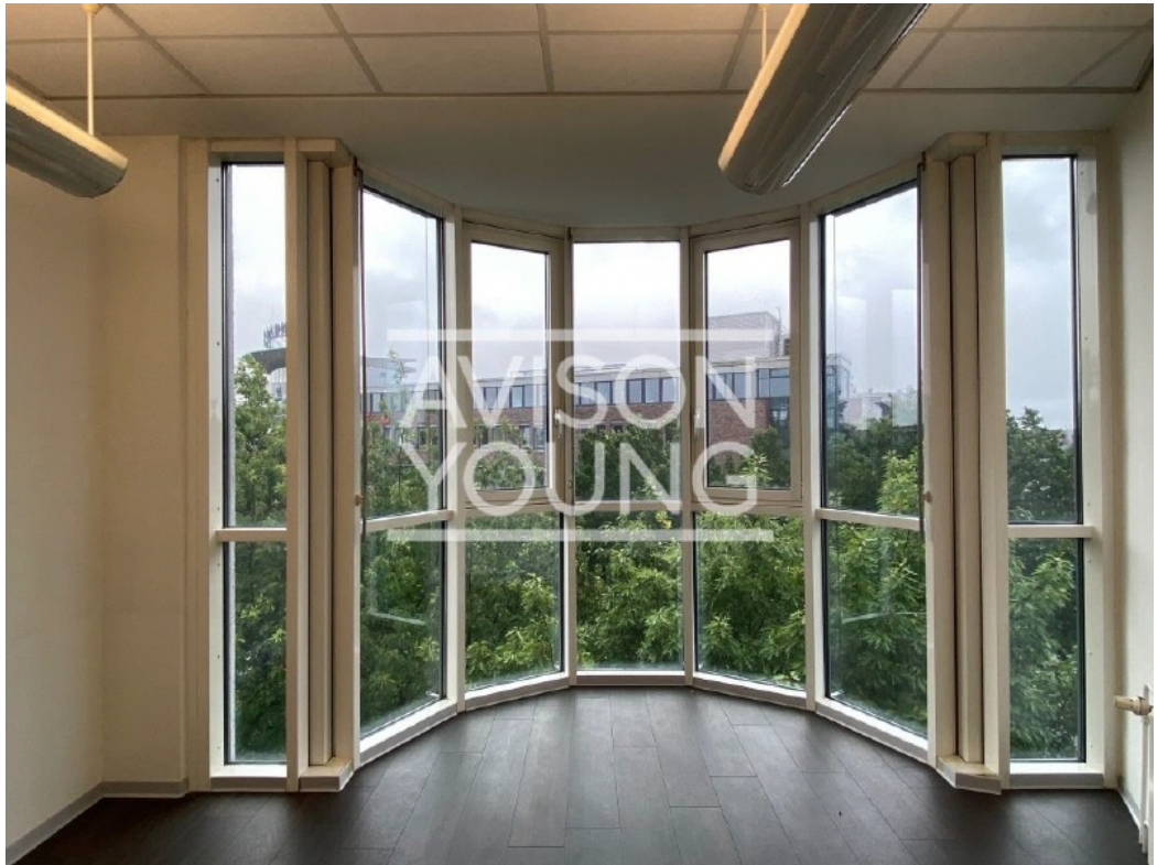
4 OG Ausblick