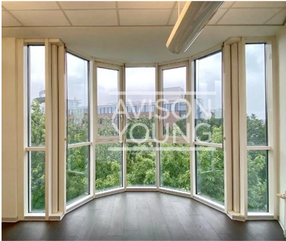
4. OG | Ausblick