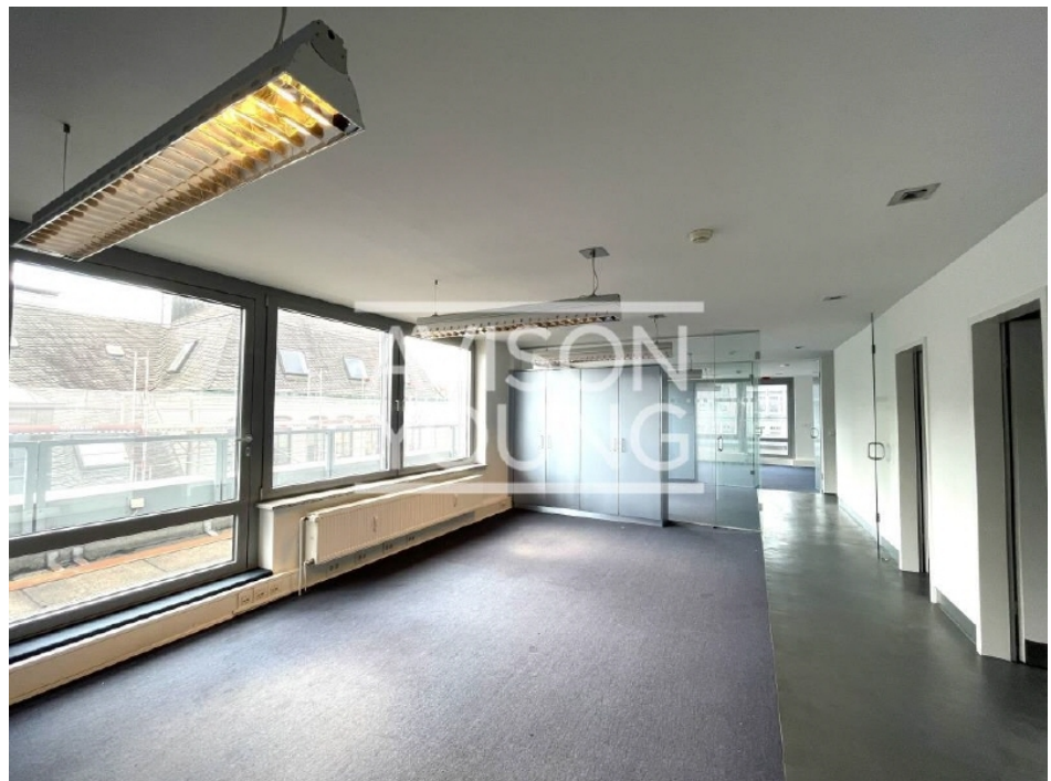
Innenansicht 6 Obergeschoss