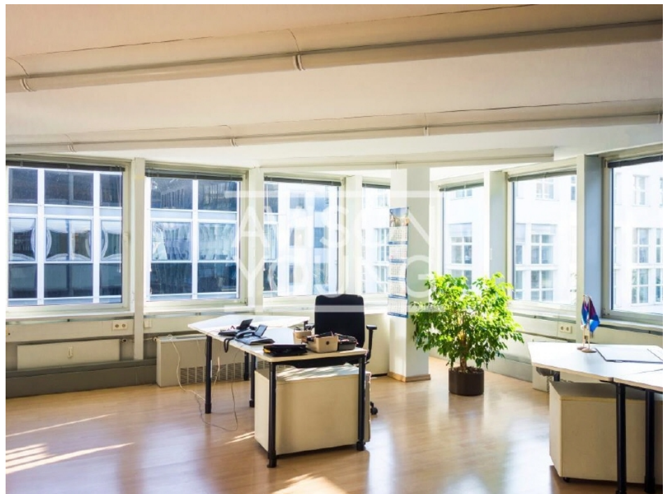
Innenansicht 4 Obergeschoss