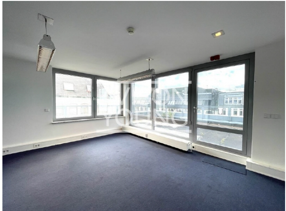
Innenansicht 6 Obergeschoss