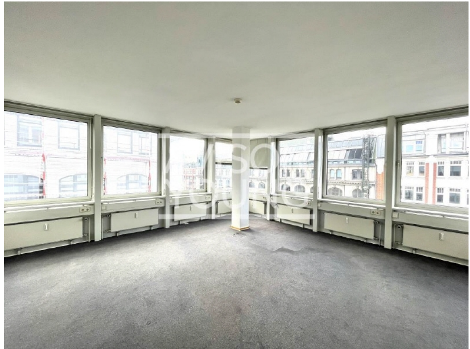
Innenansicht 5 Obergeschoss