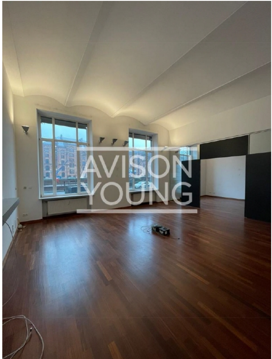
Haus 5 EG ca 235,00 m 2