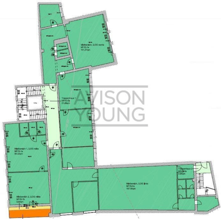
Haus 5a, 2 OG ca 100,50 m 2