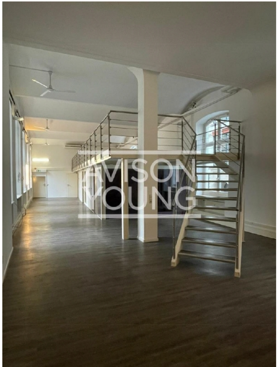
Haus 5a EG ca 281,00 m 2