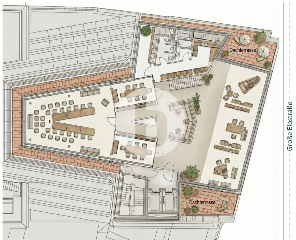
6. Obergeschoss mit ca. 503 m 2