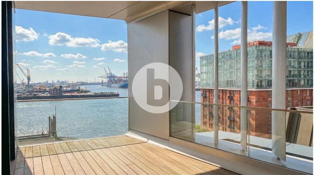
ELBE36 Große Elbstraße 36 Hamburg Hafenrand Büro Innenansicht