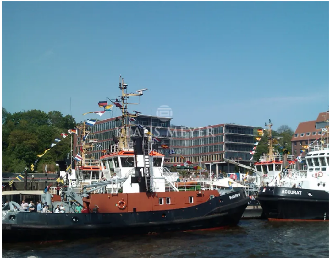
An der Elbe