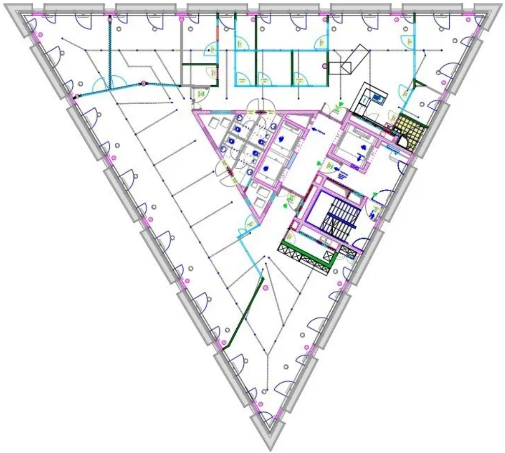
10. OG mit ca. 508 m 2