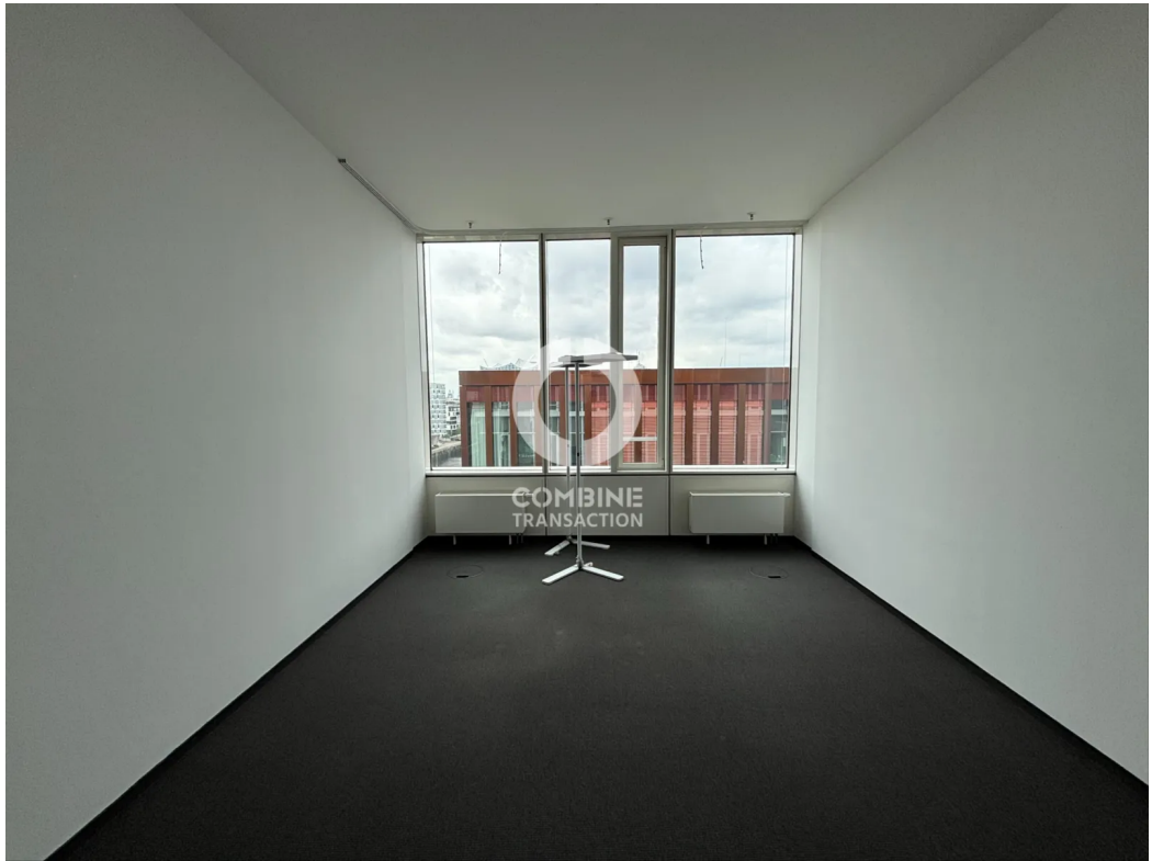
Innenansicht 7. OG