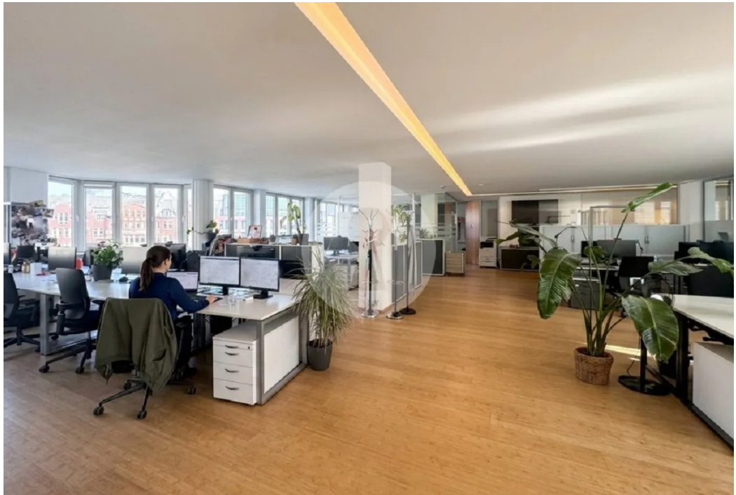
Open Space Bereich