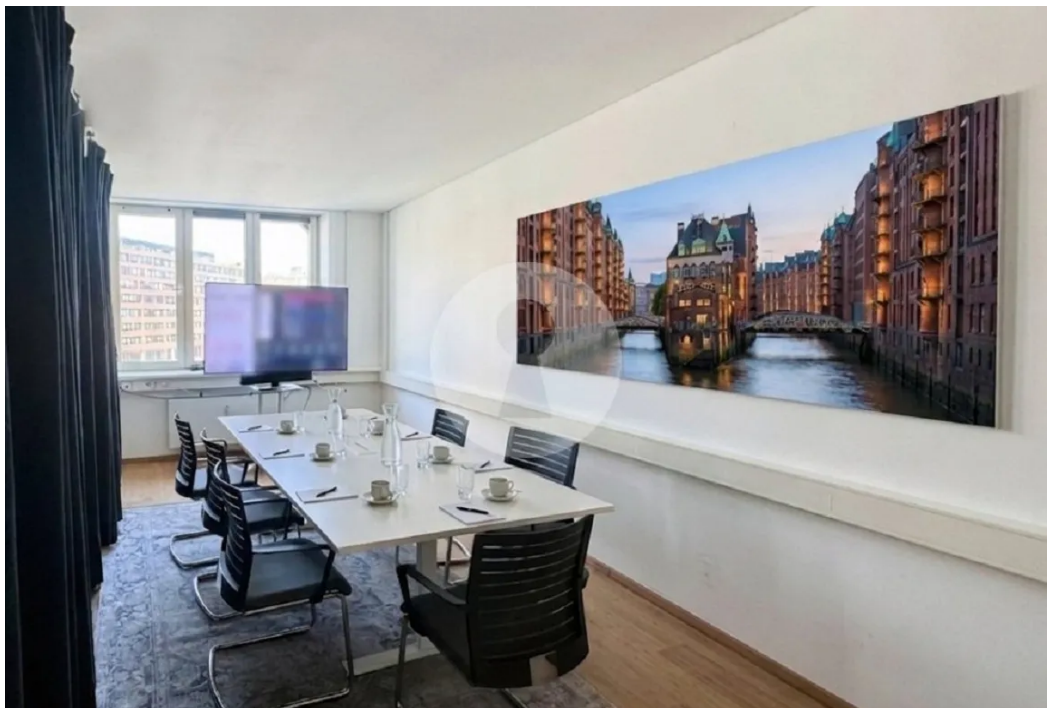
Repräsentativer Konferenzraum mit Blick auf den Gänsemarkt