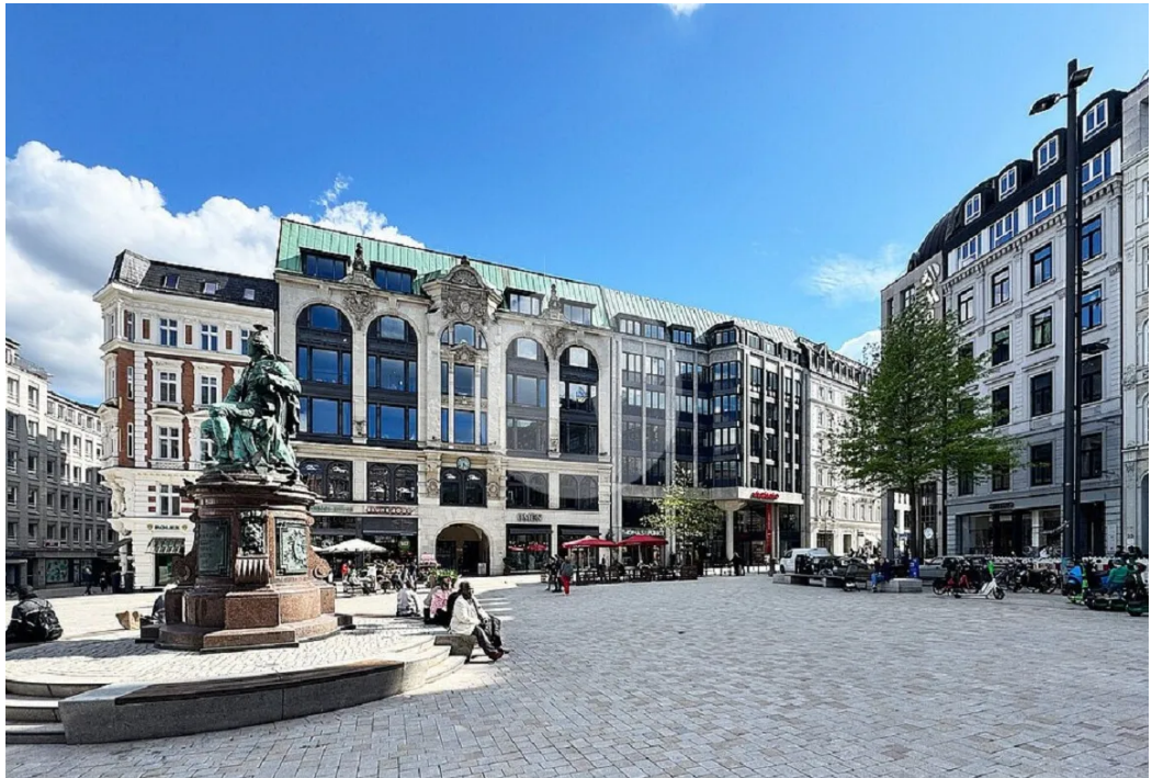
Mittendrin - alles vor der Tür