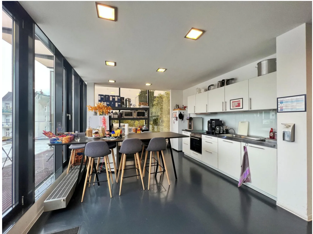
3. OG | Innenansicht