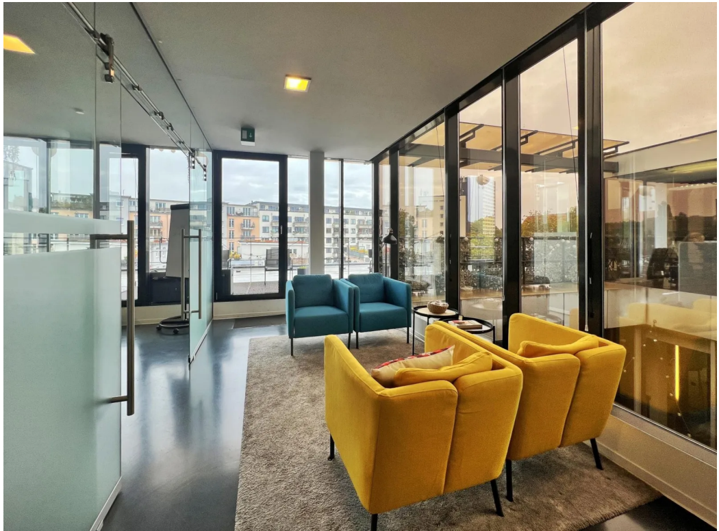
3.OG | Innenansicht