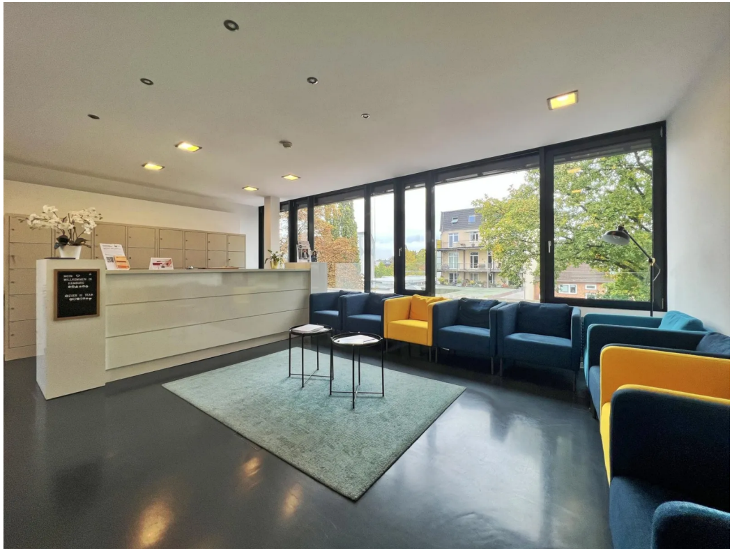
3. OG | Innenansicht