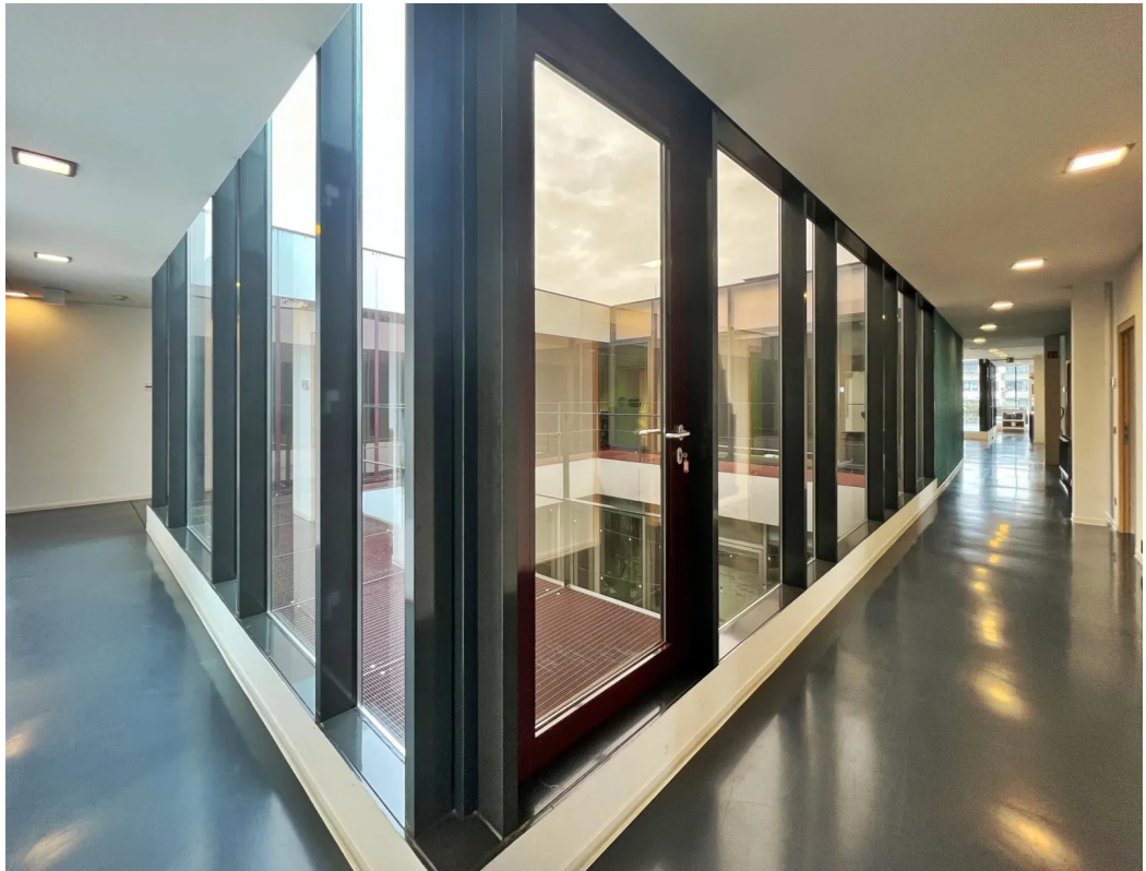
3. OG | Innenansicht