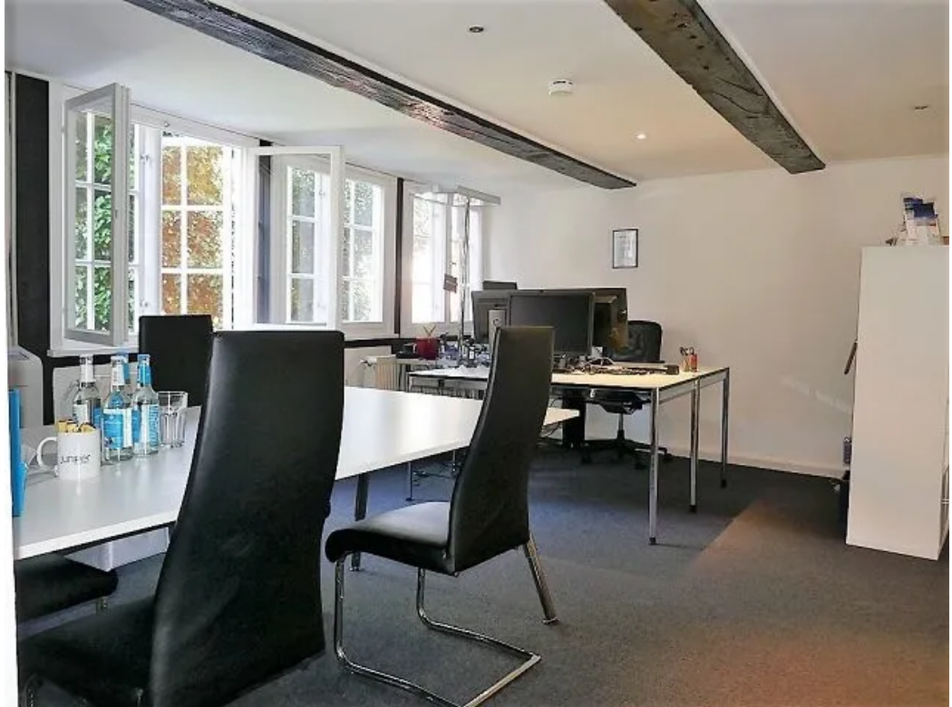
Beispiel im Büro