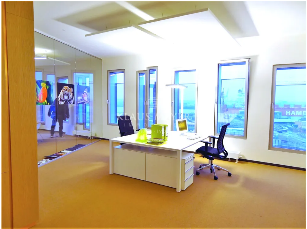
Beispiel Ausstattung Musterbüro (2)