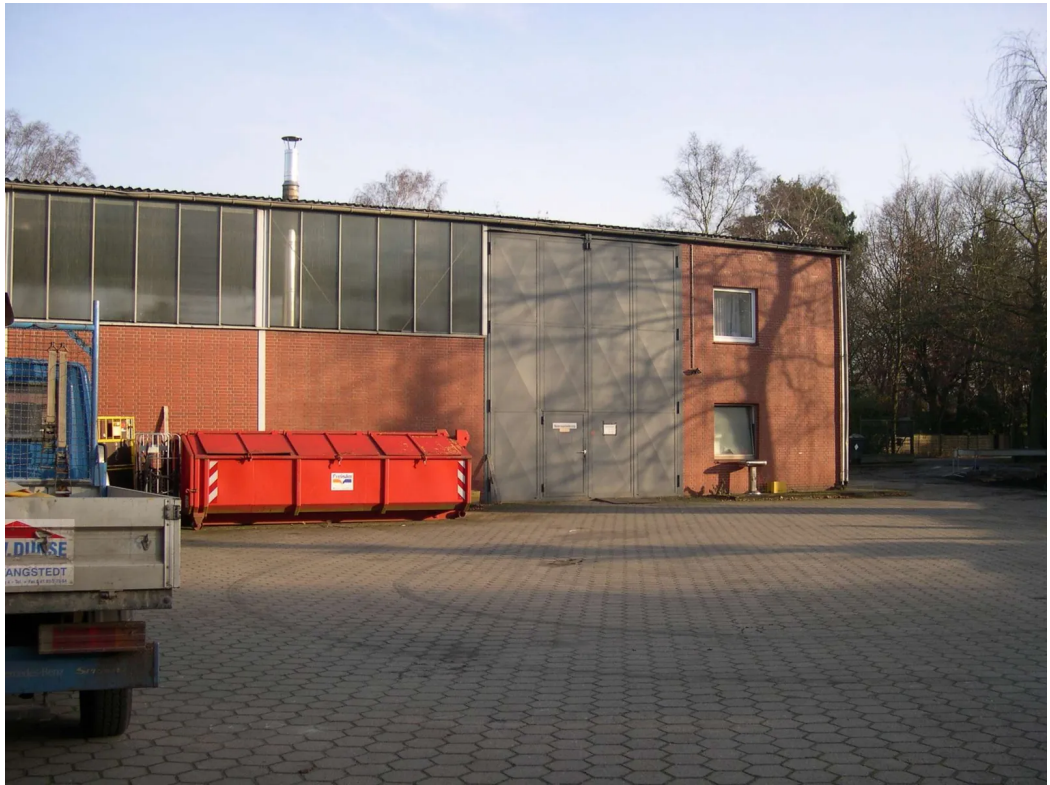
Aussenansicht Halle 1