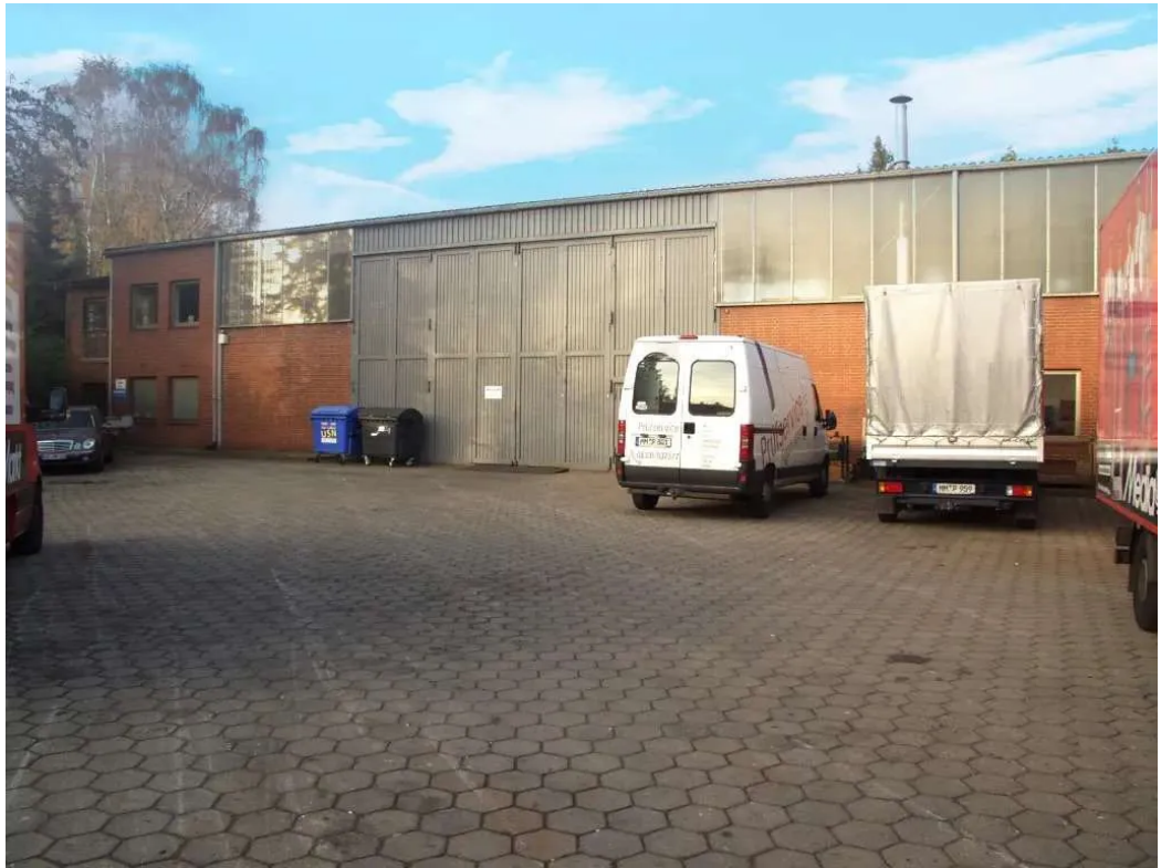
Aussenansicht Halle 2