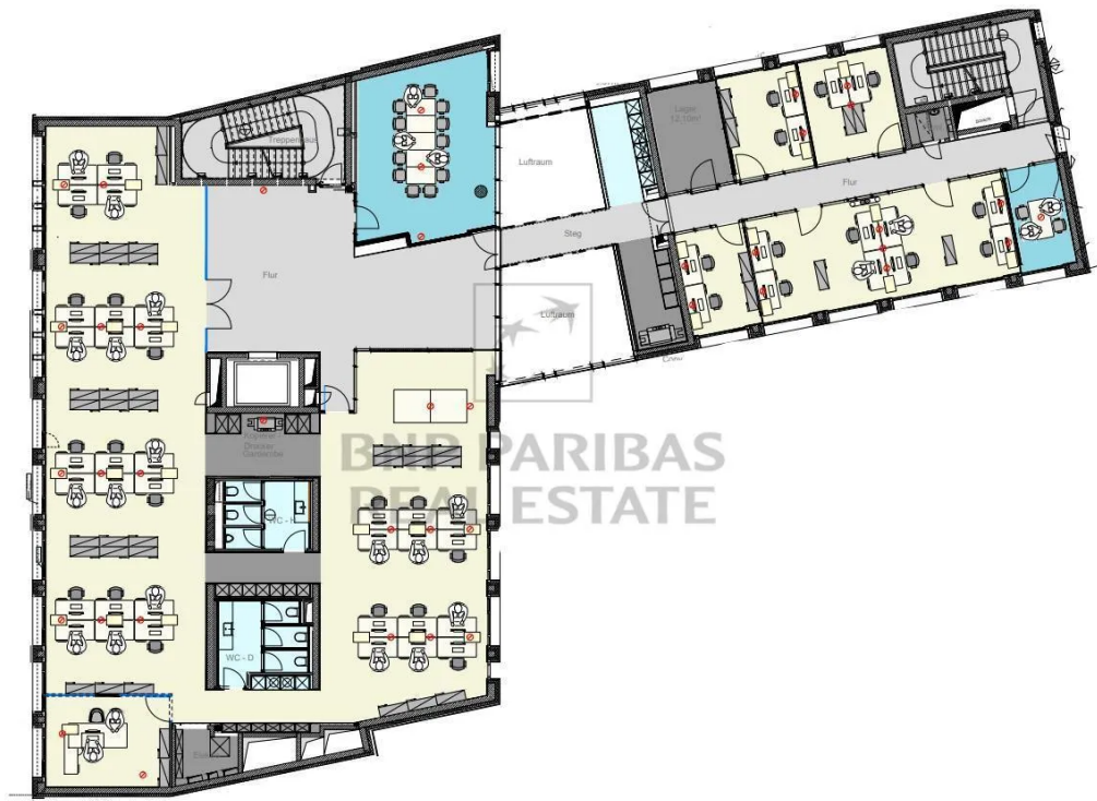
Grundriss - 1. Obergeschoss