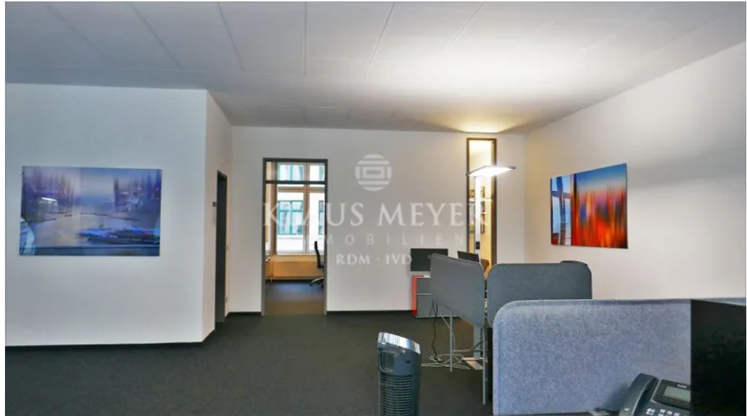
Beispiel im Büro