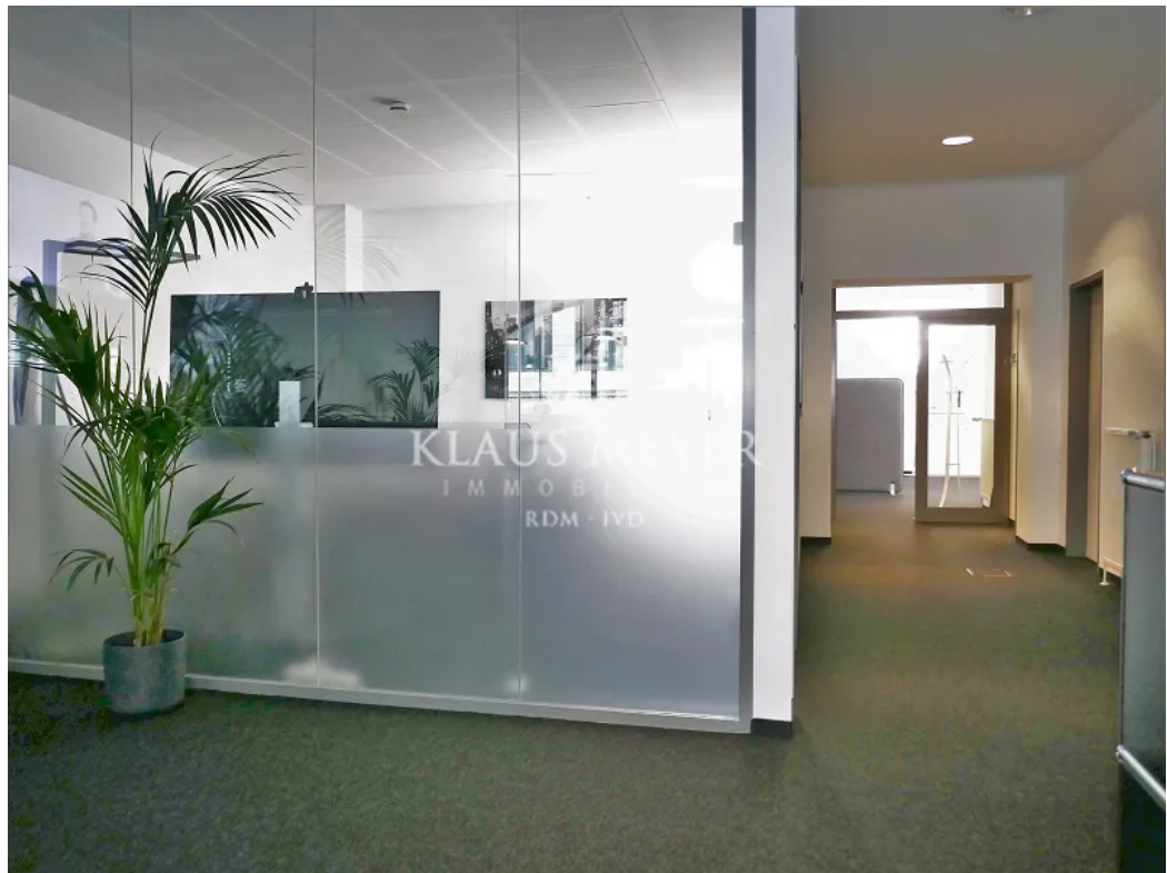
Beispiel im Büro