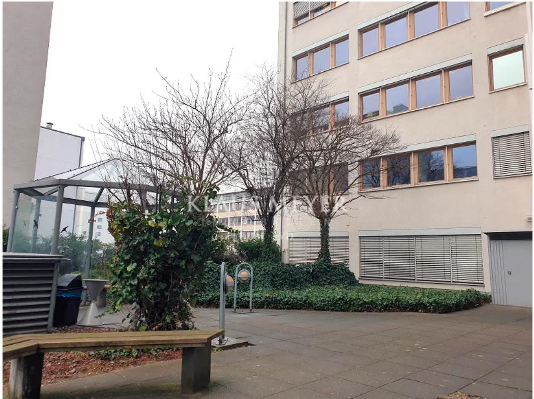
Ruhezone im Hof