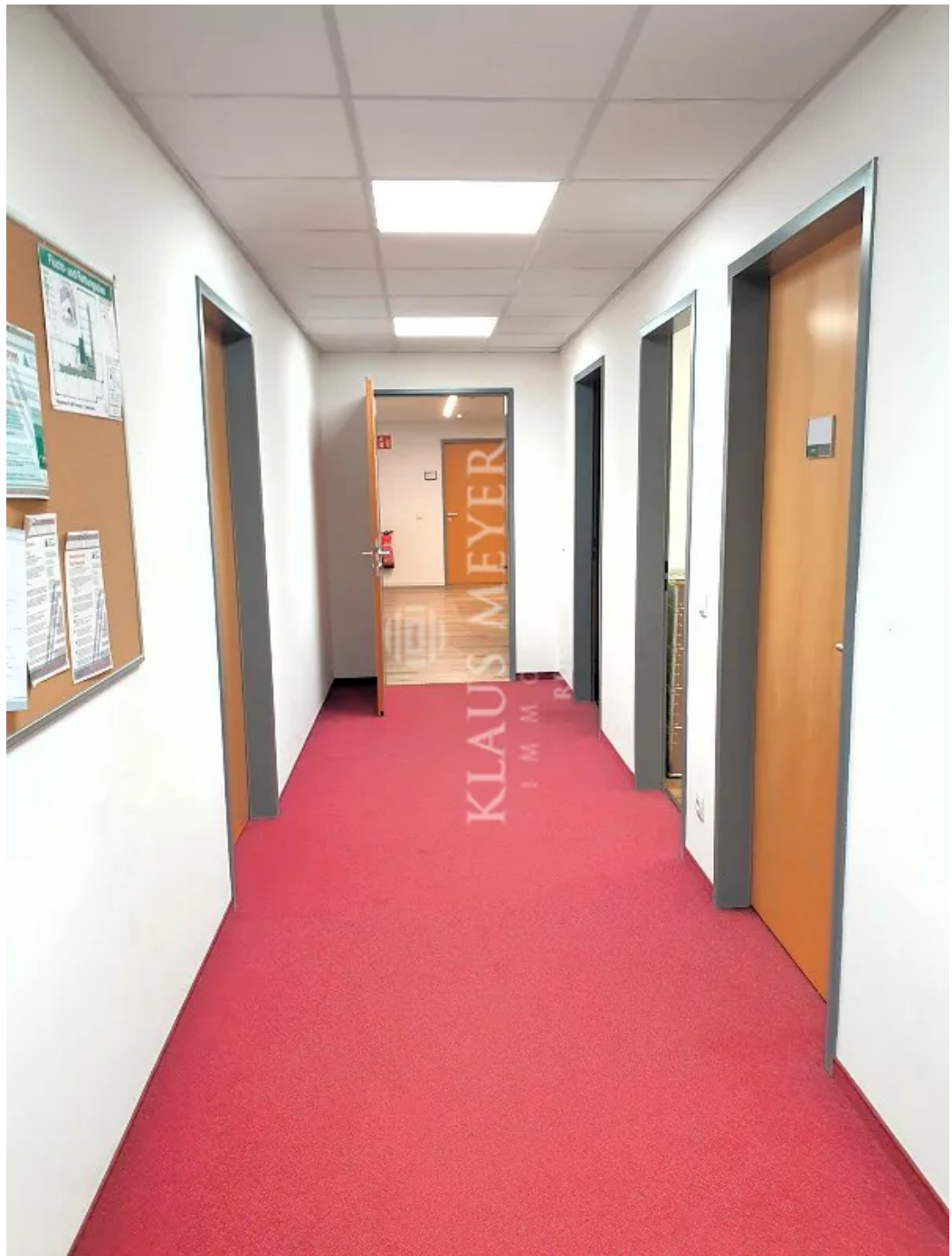
in der Fläche