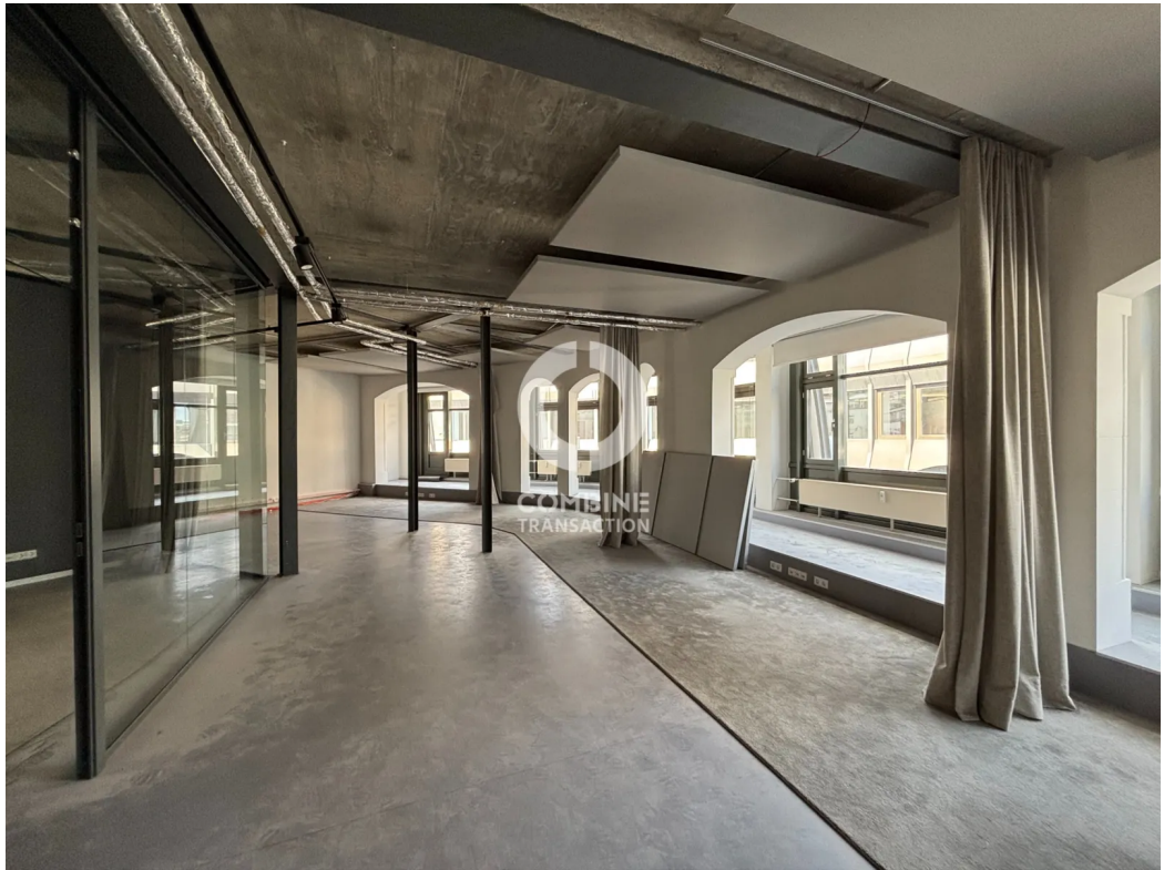
Innenansicht 4. OG