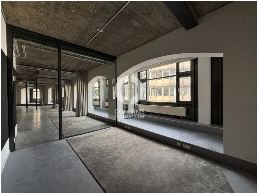
Innenansicht 4. OG