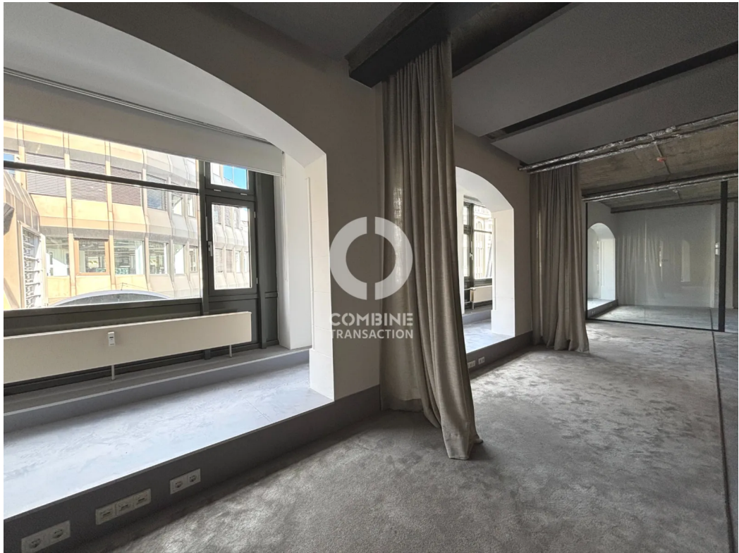
Innenansicht 4. OG