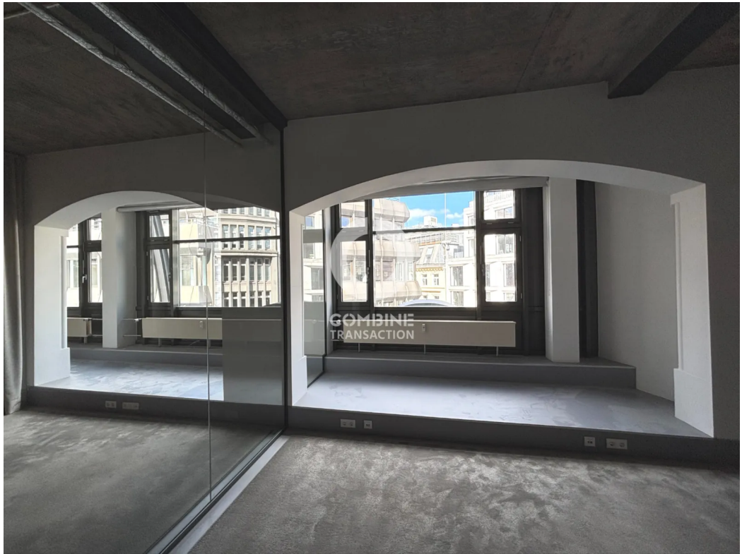
Innenansicht 4. OG