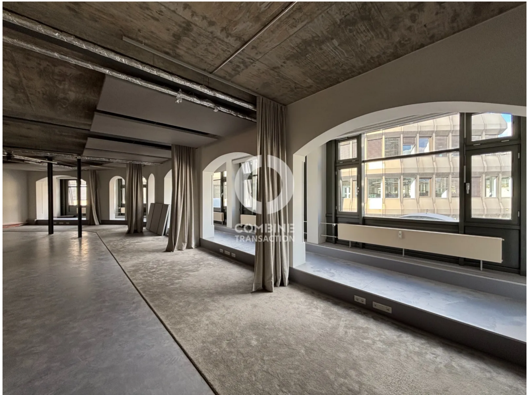
Innenansicht 4. OG