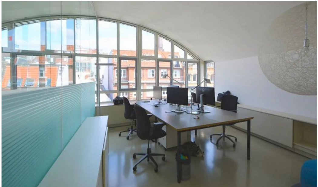
Weitere Ansichten 6. OG