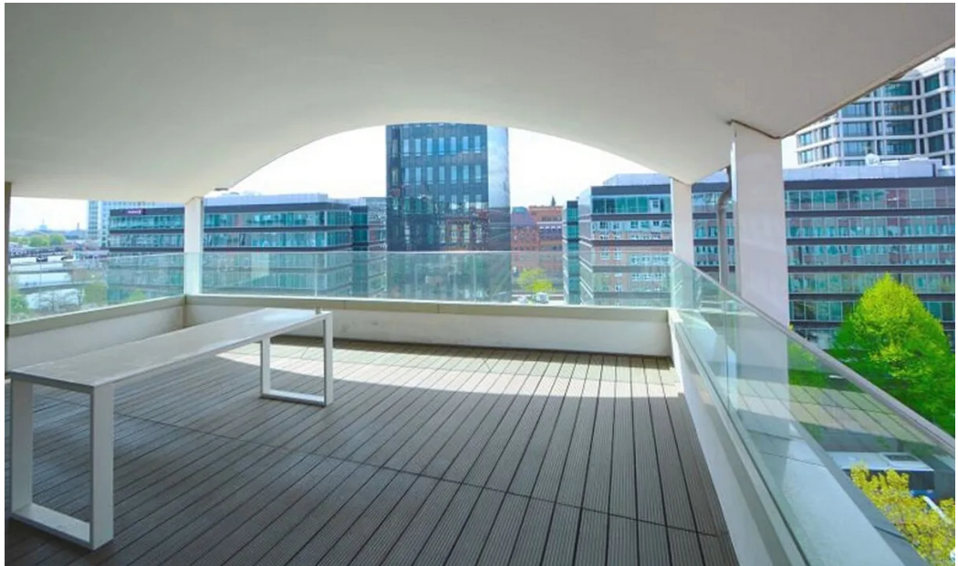
Weitere Ansichten 6. OG