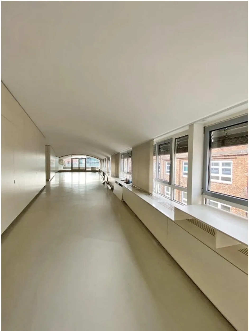
Weitere Ansichten 6. OG