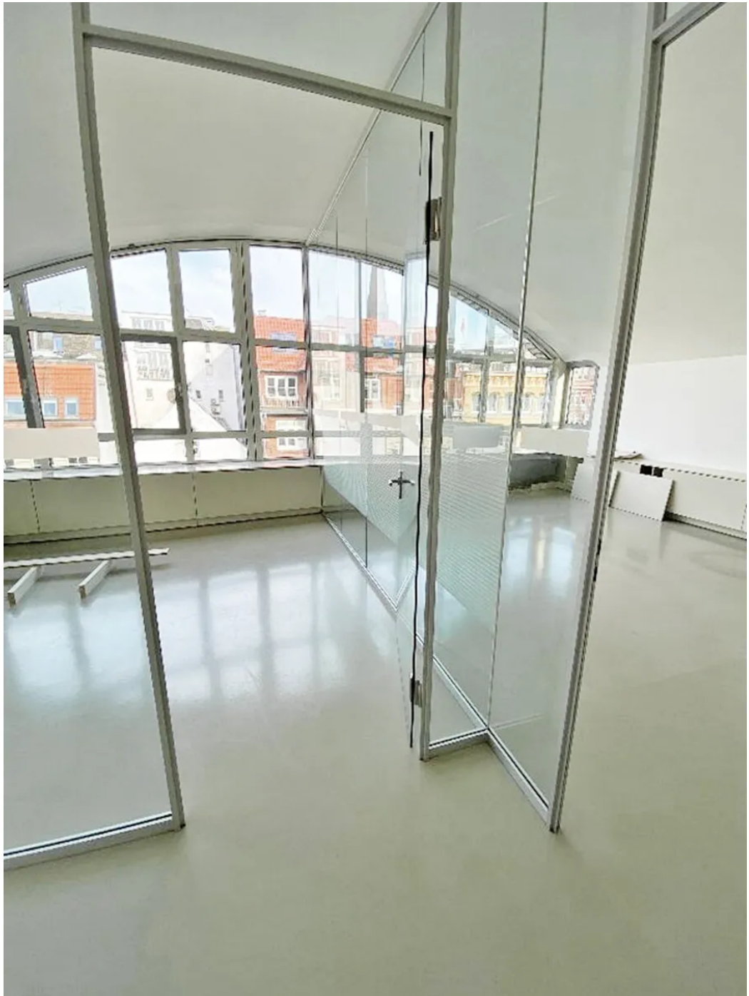
Weitere Ansichten 6. OG