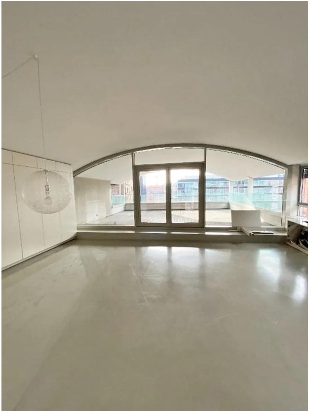
Weitere Ansichten 6. OG