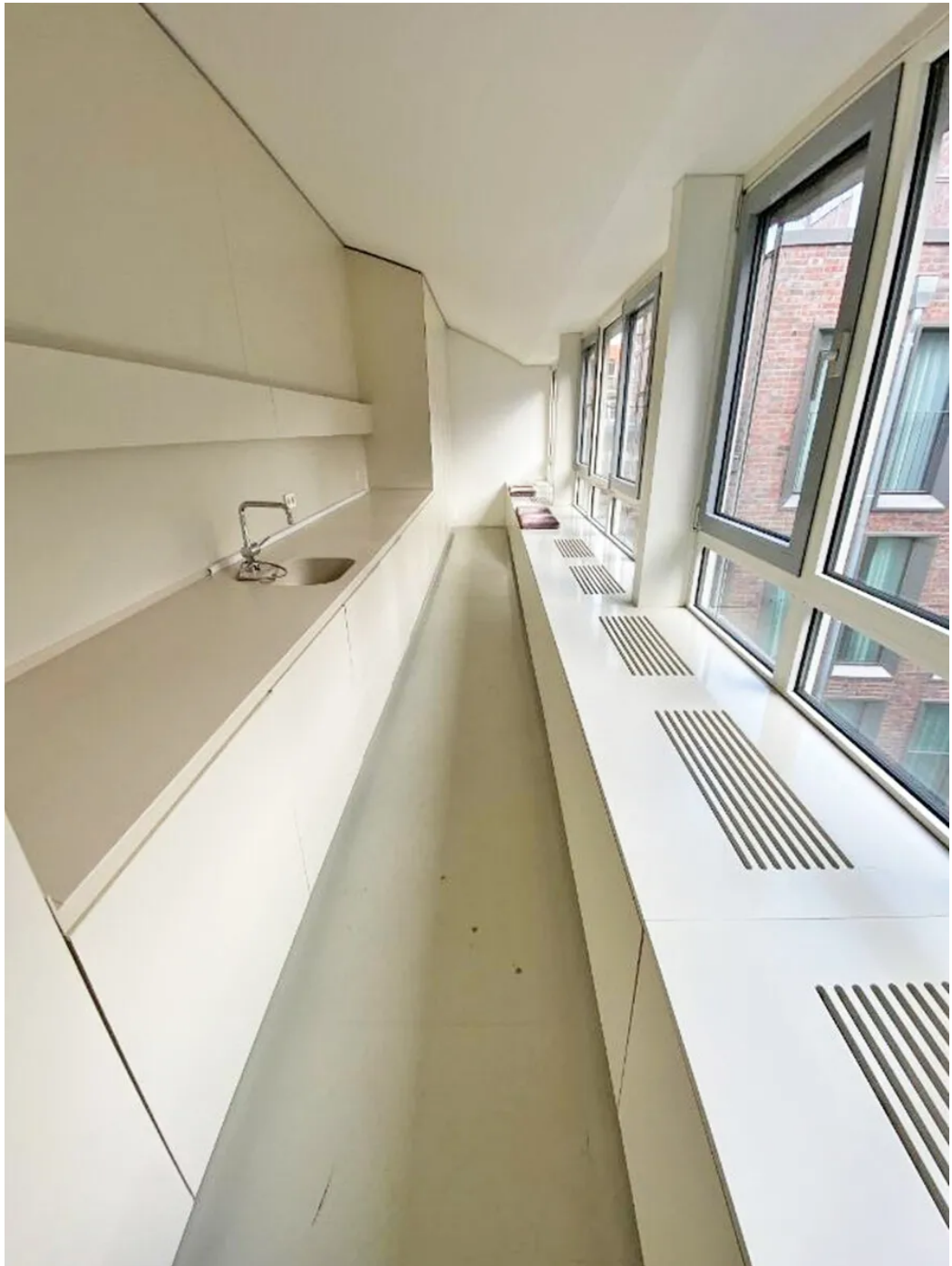
Weitere Ansichten 6. OG