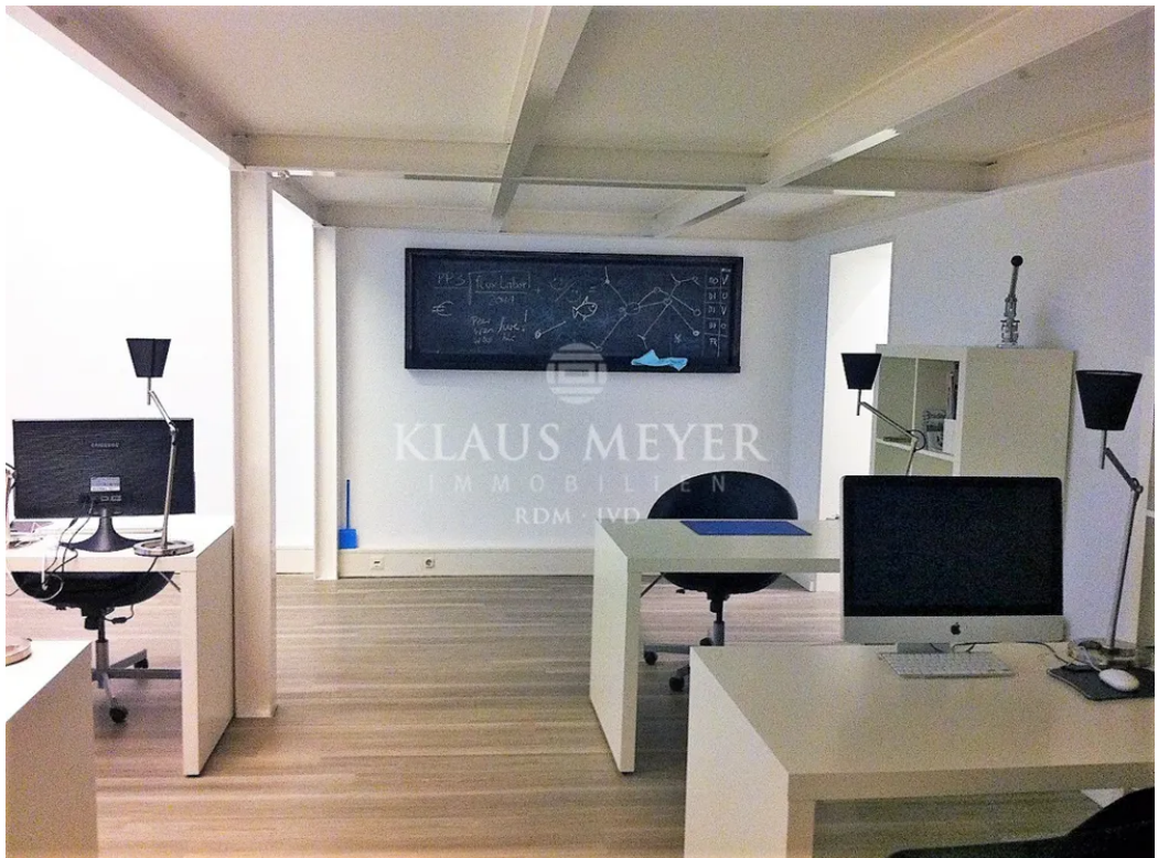
im Büro 145m 2