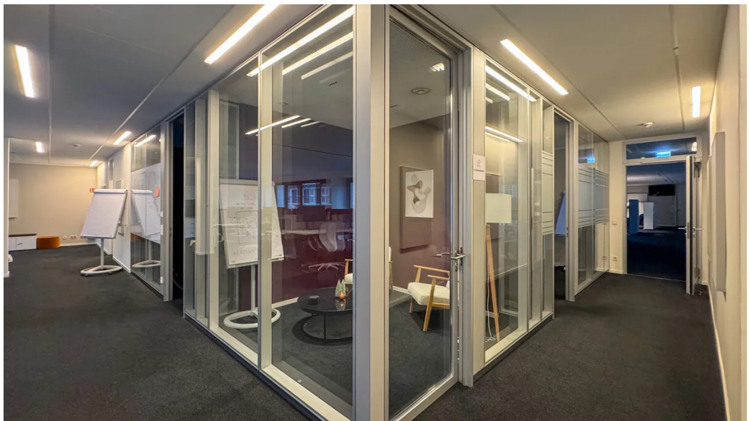
Weitere Ansichten - 3. OG