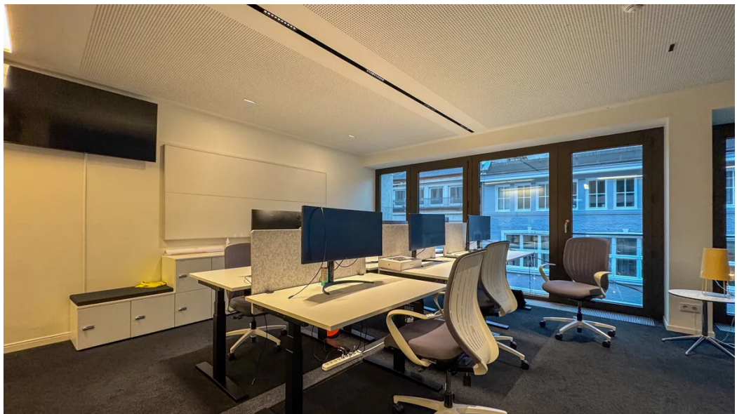
Weitere Ansichten - 3. OG