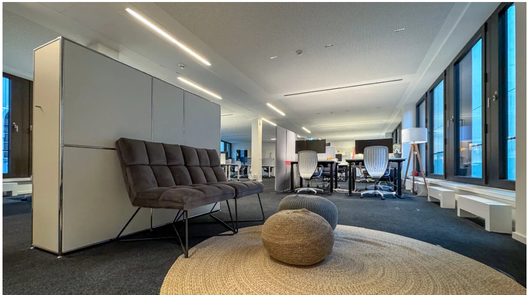
Weitere Ansichten - 3. OG