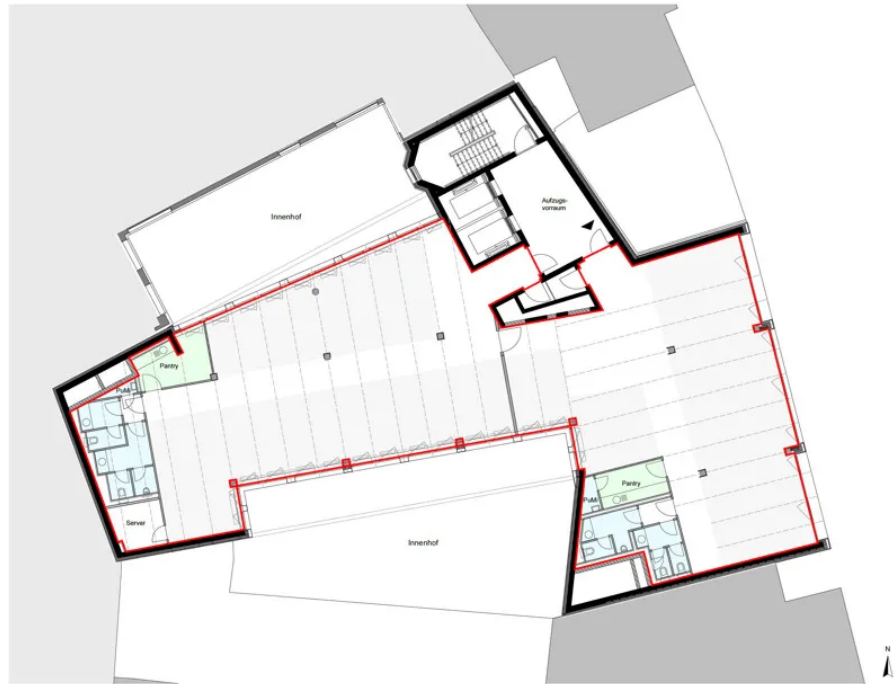
Grundriss 3. OG - ohne Mieterausbau