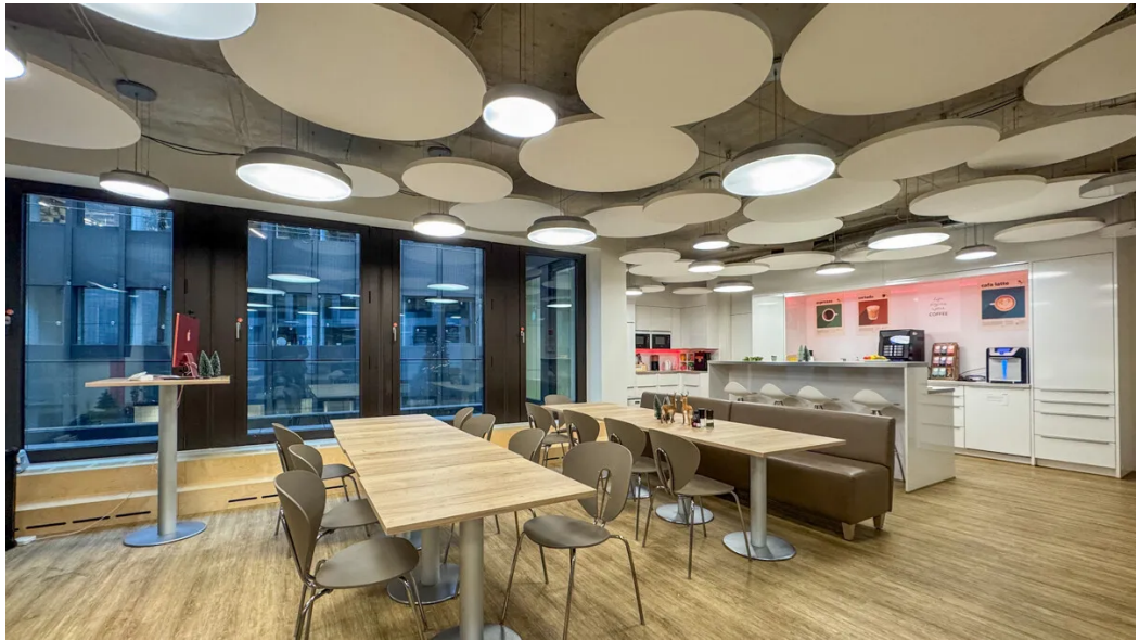
Weitere Ansichten - 2. OG