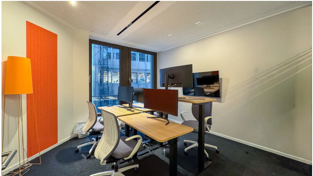
Weitere Ansichten - 3. OG