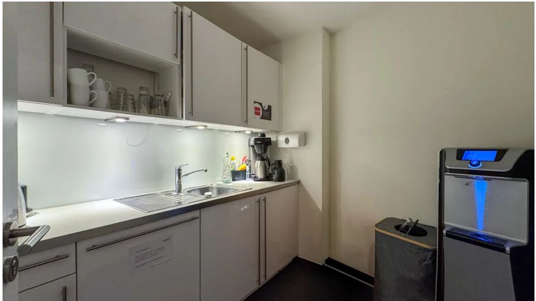
Weitere Ansichten - 3. OG