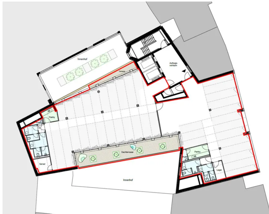
Grundriss 2. OG - ohne Mieterausbau