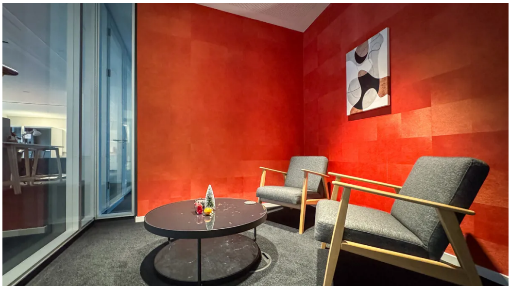
Weitere Ansichten - 2. OG