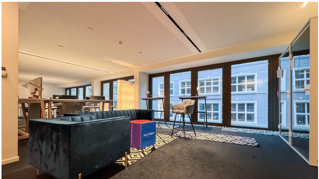
Weitere Ansichten - 2. OG