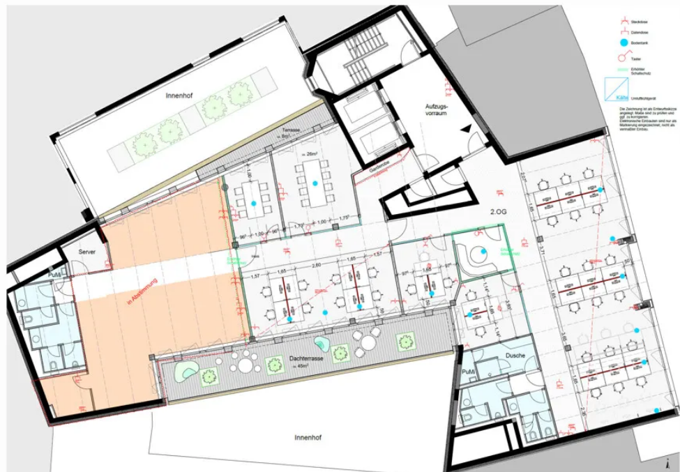
Grundriss 2. OG - Mieterausbau