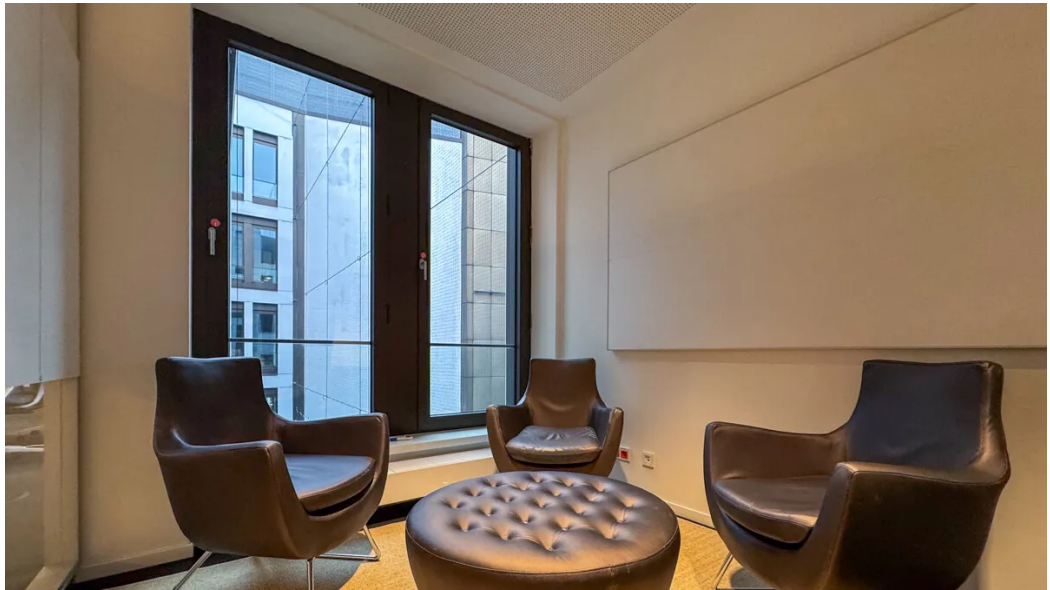
Weitere Ansichten - 3. OG