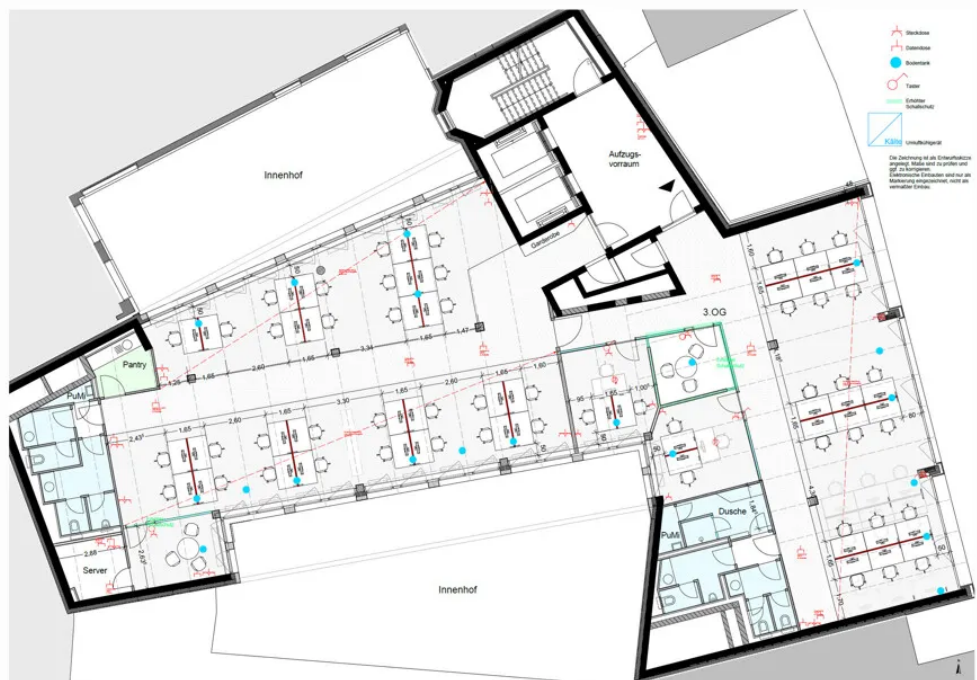
Grundriss 3. OG - Mieterausbau