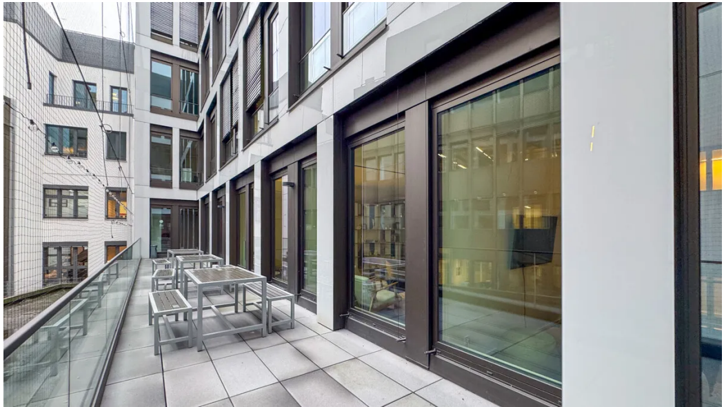
Weitere Ansichten - 2. OG