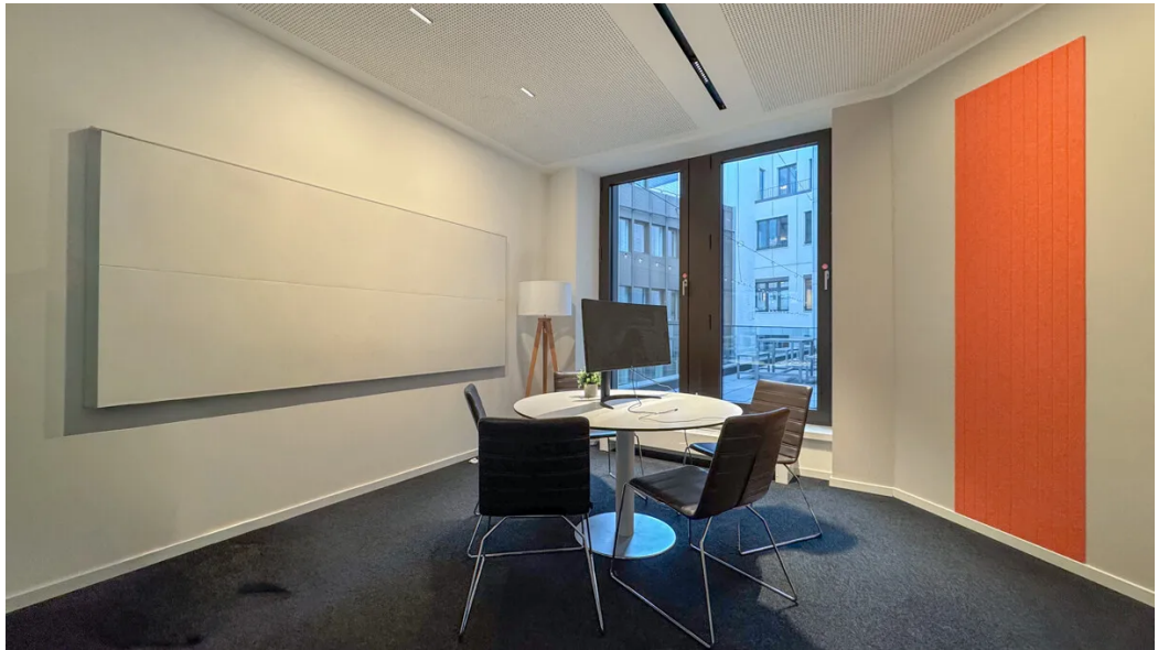
Weitere Ansichten - 2. OG