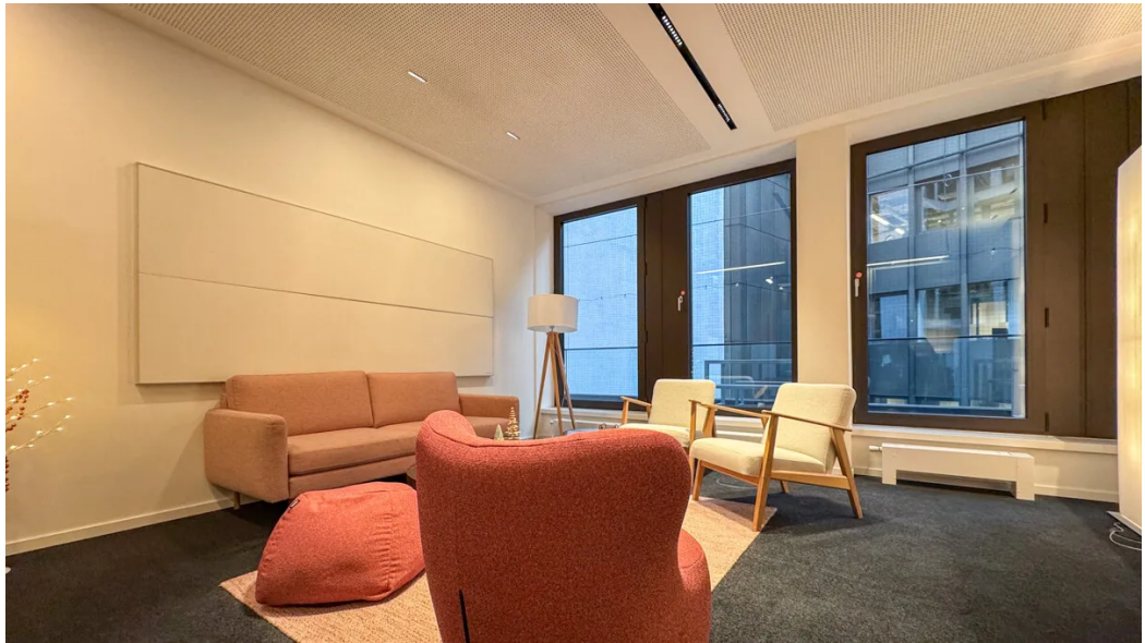
Weitere Ansichten - 2. OG