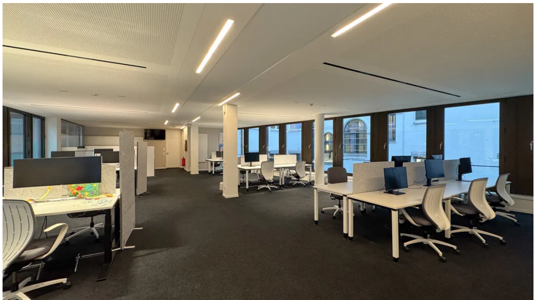
Weitere Ansichten - 3. OG