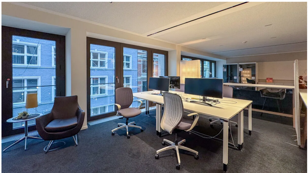
Weitere Ansichten - 2. OG