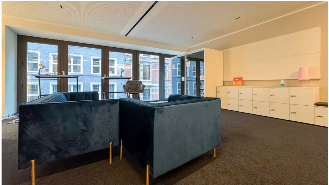
Weitere Ansichten - 2. OG