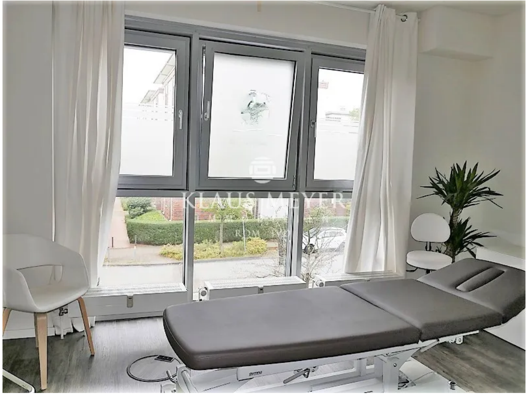
in der Fläche