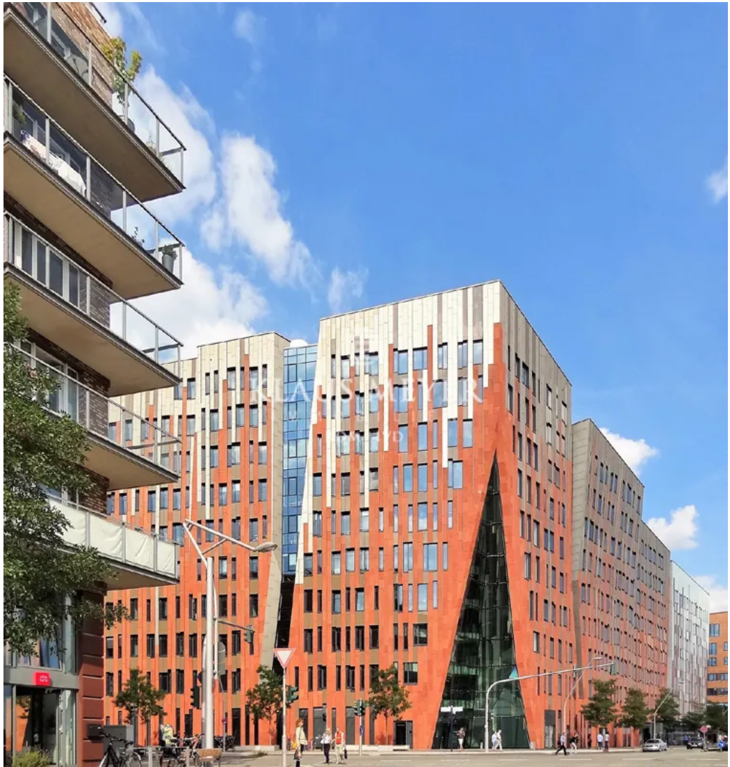
Ansicht Sumatra Haupteingang