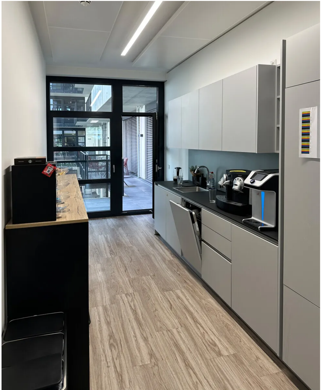
Weitere Ansichten 1. OG