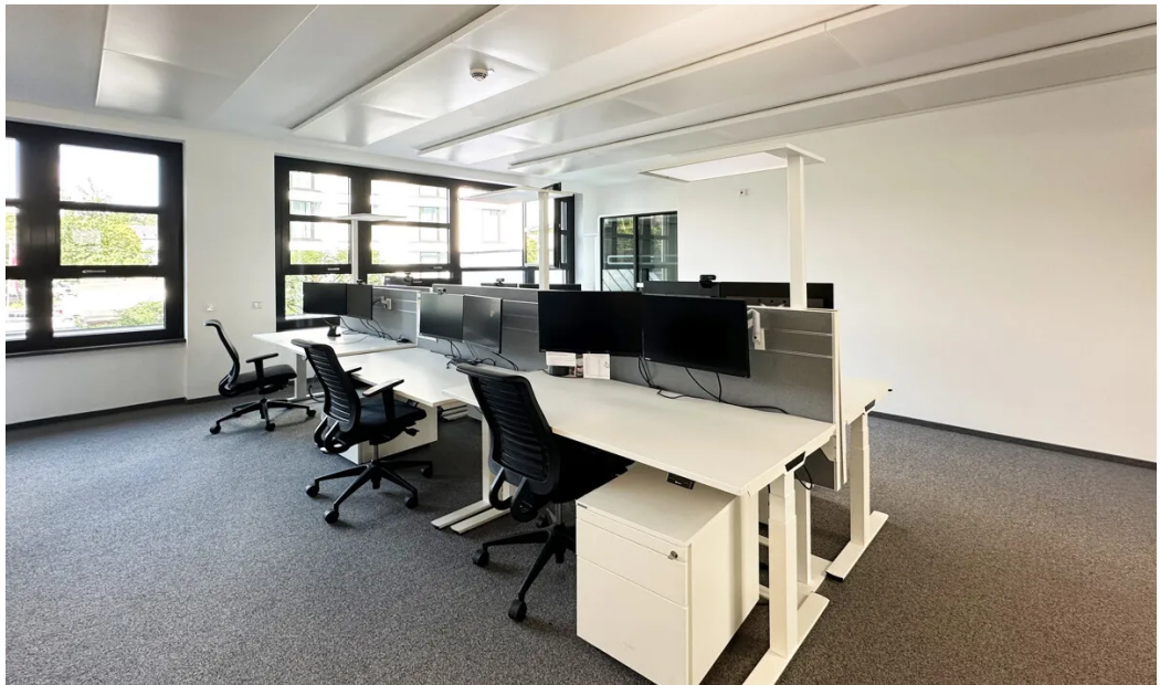
Weitere Ansichten 1. OG