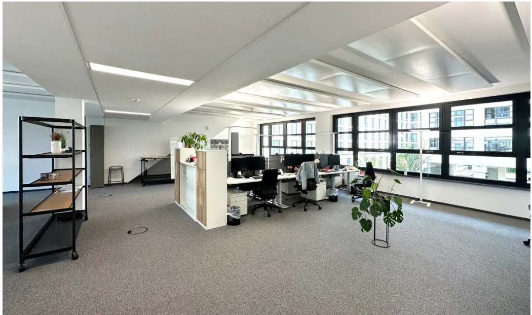
Weitere Ansichten 1. OG