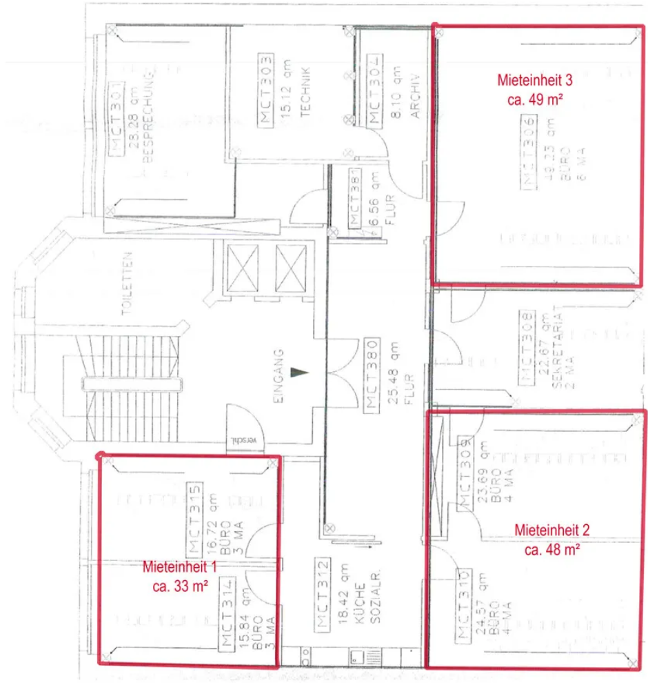
Variante Anmietung Teilflächen (2. OG)