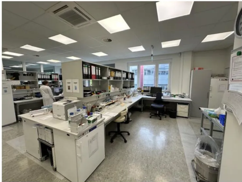
Labor- Groß EG Zentrallabor Kühlhaus groß (4J NP 11.000 €)