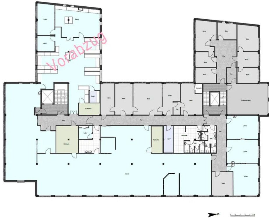
Grundriss 1. OG