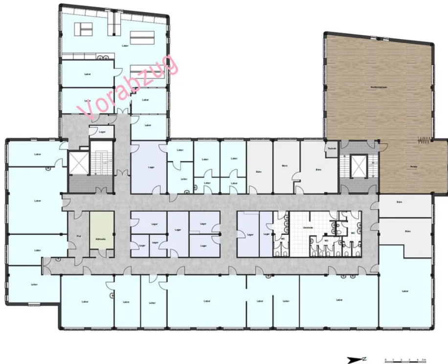
Grundriss 2. OG