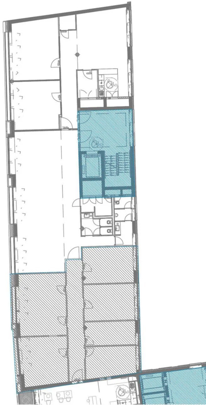
Grundriss 3. OG