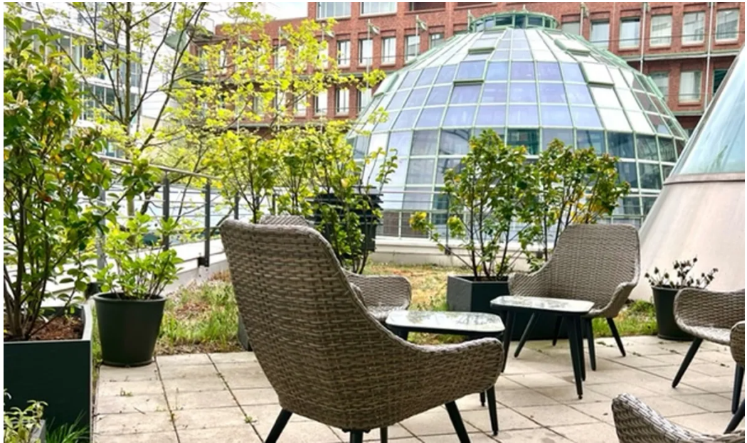
Weitere Ansichten - 1. OG