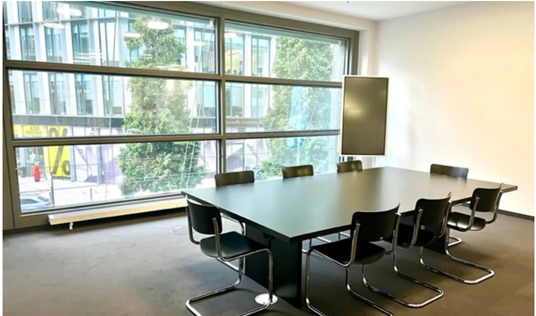
Weitere Ansichten - 1. OG