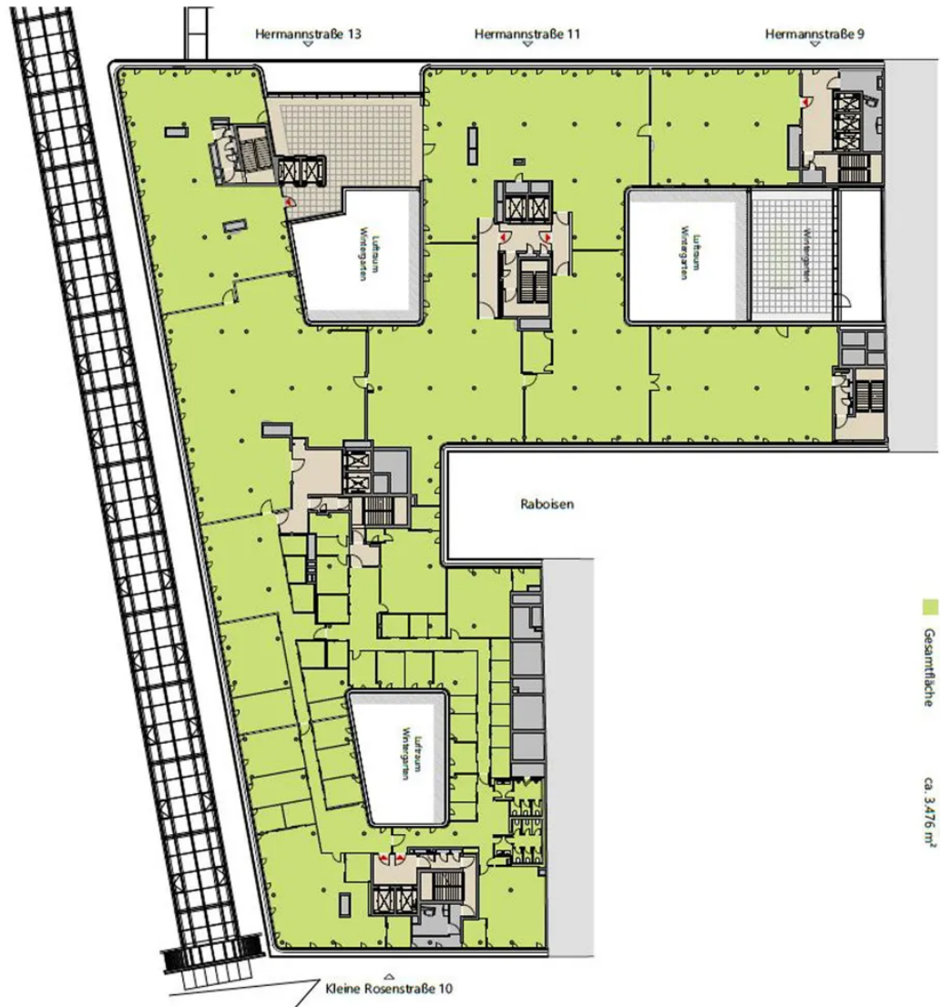
Grundriss 5. OG (ca. 3.476m 2 )