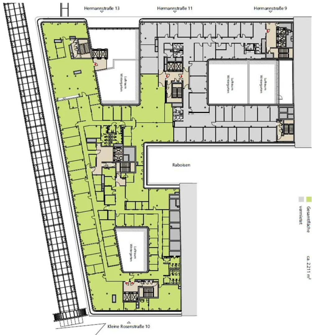
Grundriss 6. OG (ca. 2.211m 2 )