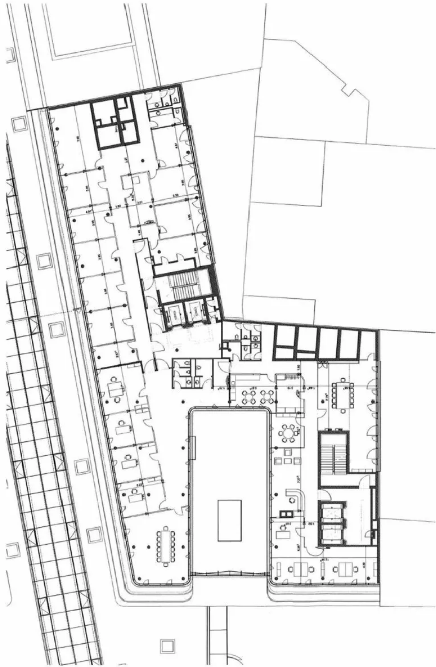
Grundriss 7. OG - Bauteil B (ca. 993m 2 )