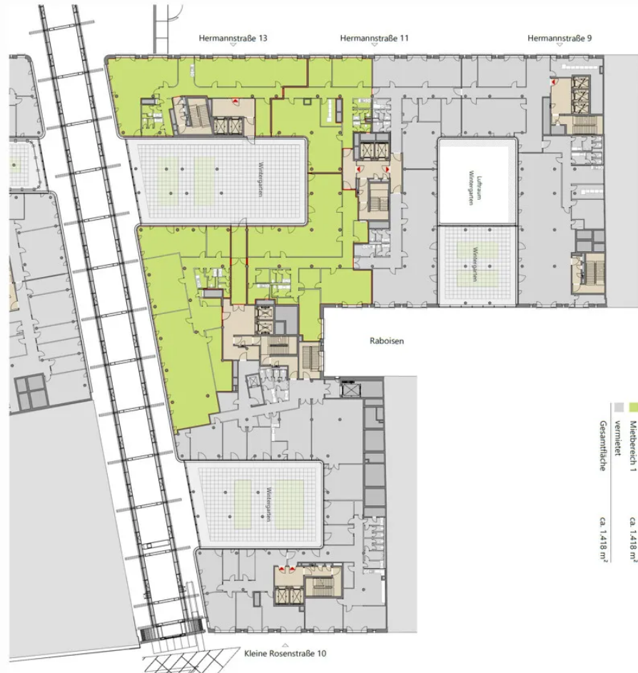
Grundriss 3. OG (ca. 1.418 m 2 )