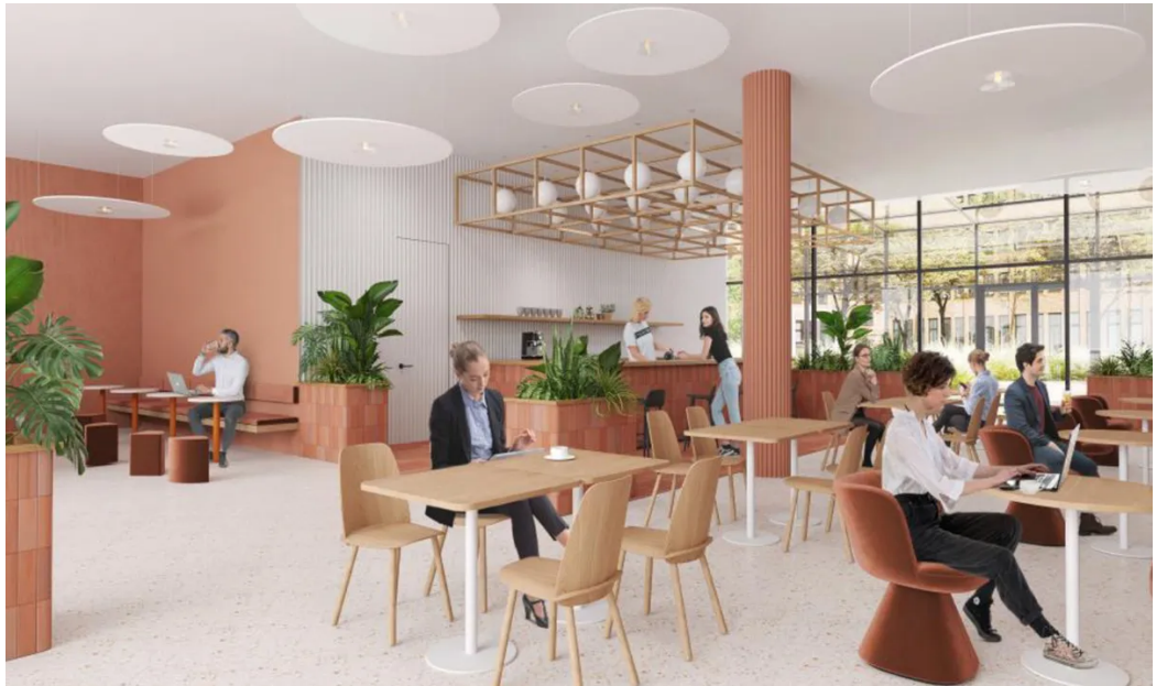
Weitere Ansichten - Visualisierung