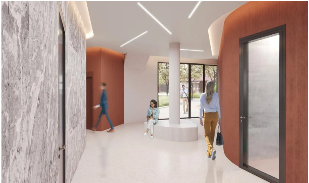
Weitere Ansichten - Visualisierung