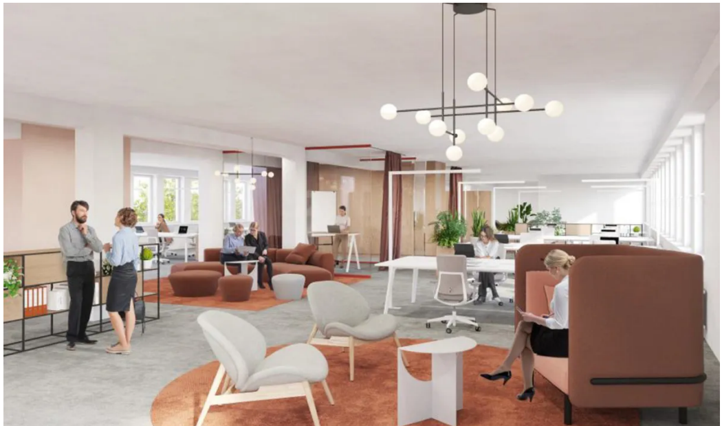
Weitere Ansichten - Visualisierung