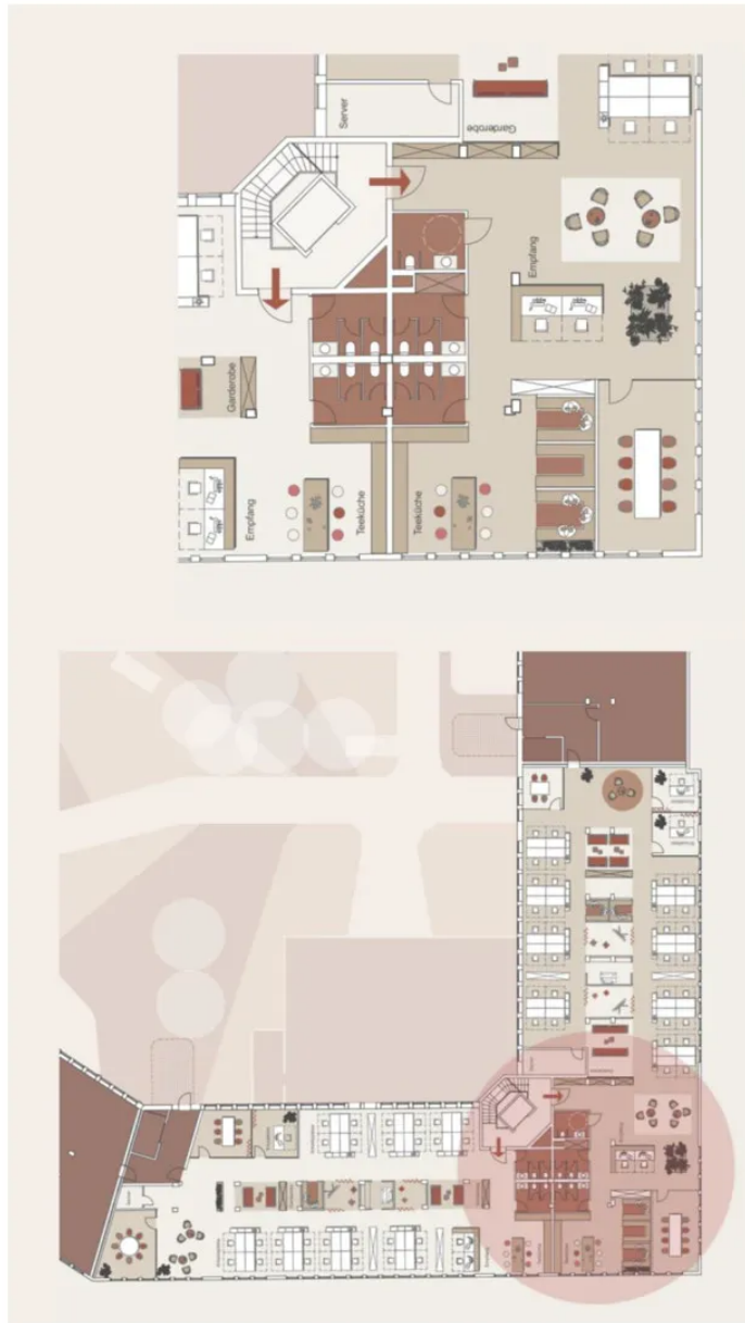
Grundriss Mieteinheit - ca. 1.022 m 2 (beispielhafte Möblierung)