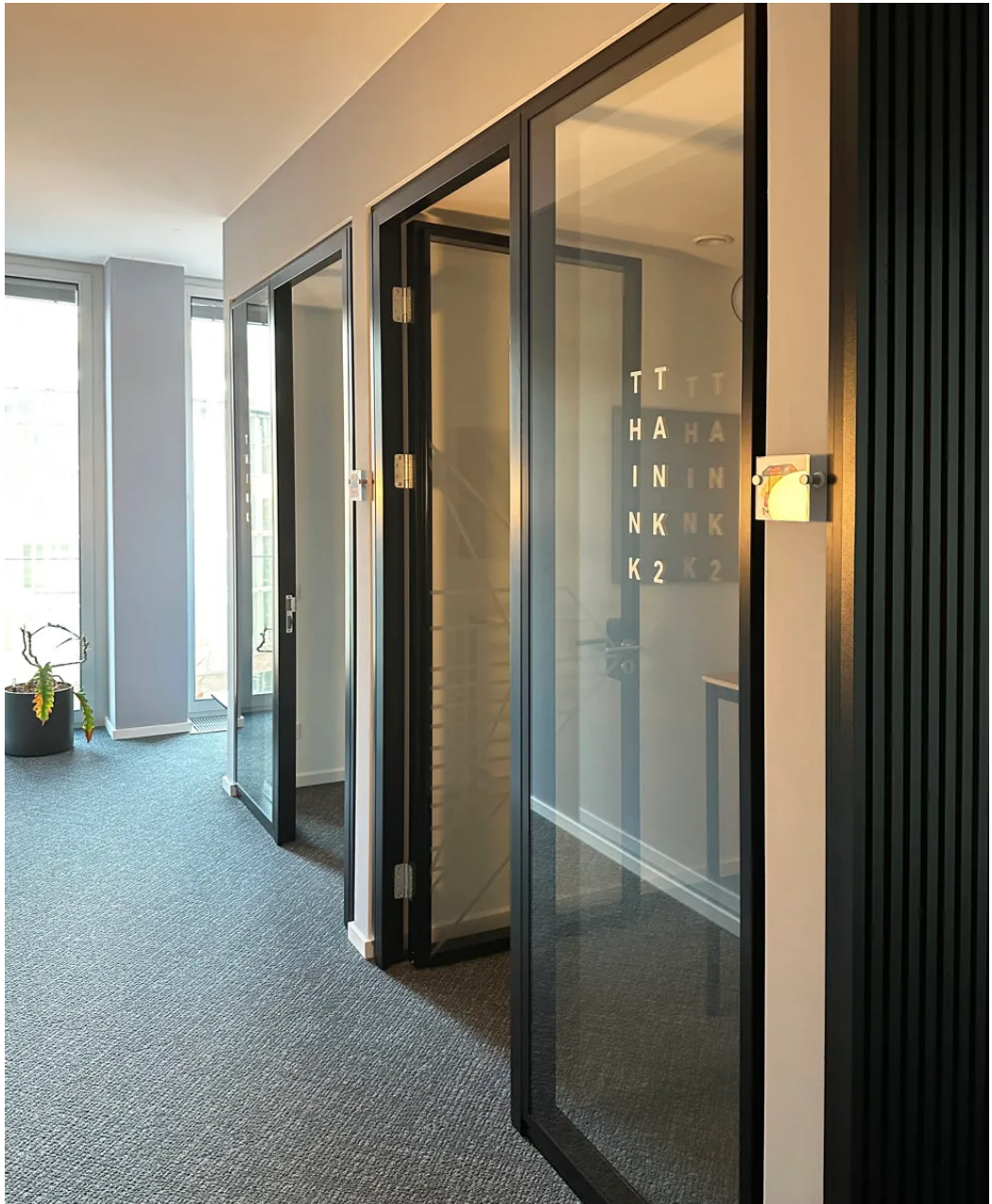
Weitere Ansichten - 4. OG