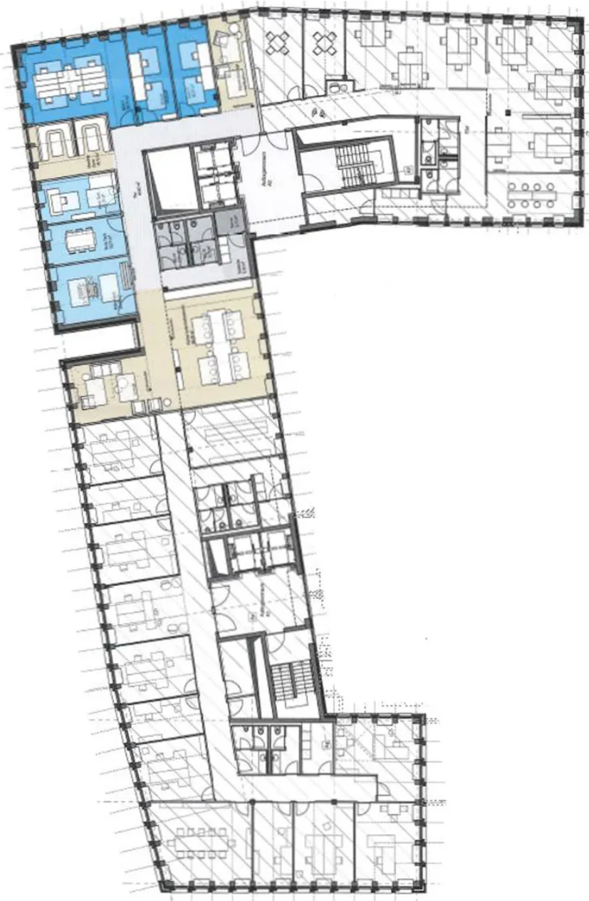
Grundriss - 4. OG (ca. 350m 2 )