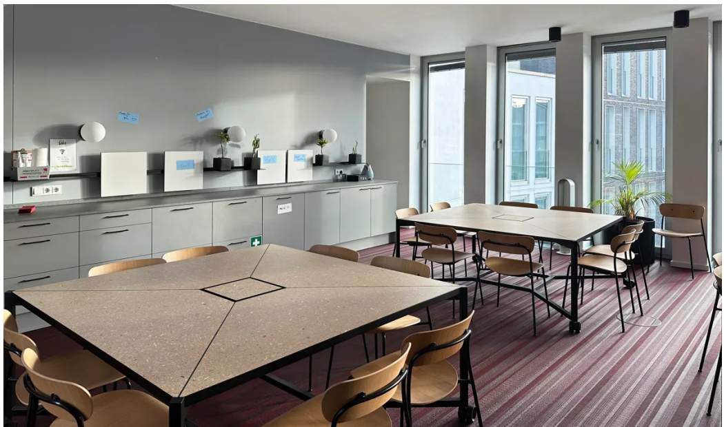
Weitere Ansichten - 4. OG