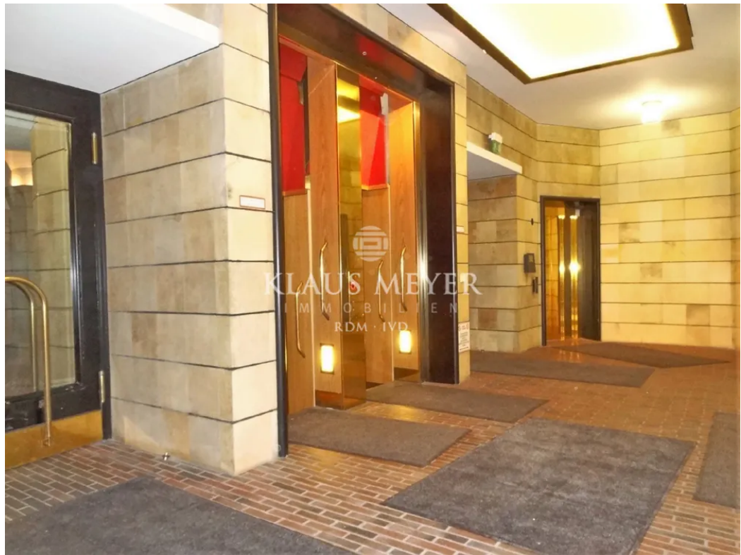
Paternoster u. Aufzug