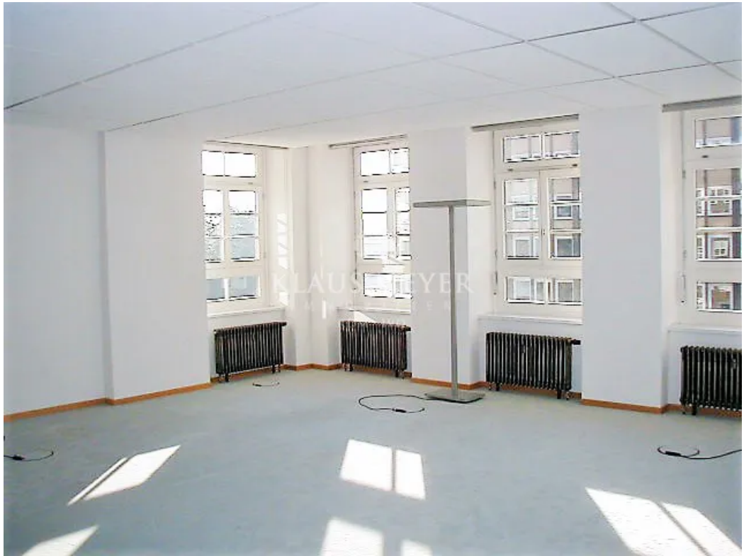
Beispiel helle Büros