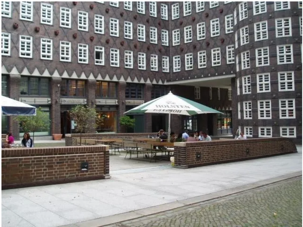
Gastro im Haus