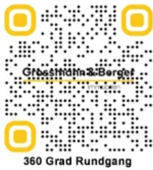
QR Code Titelbild klein