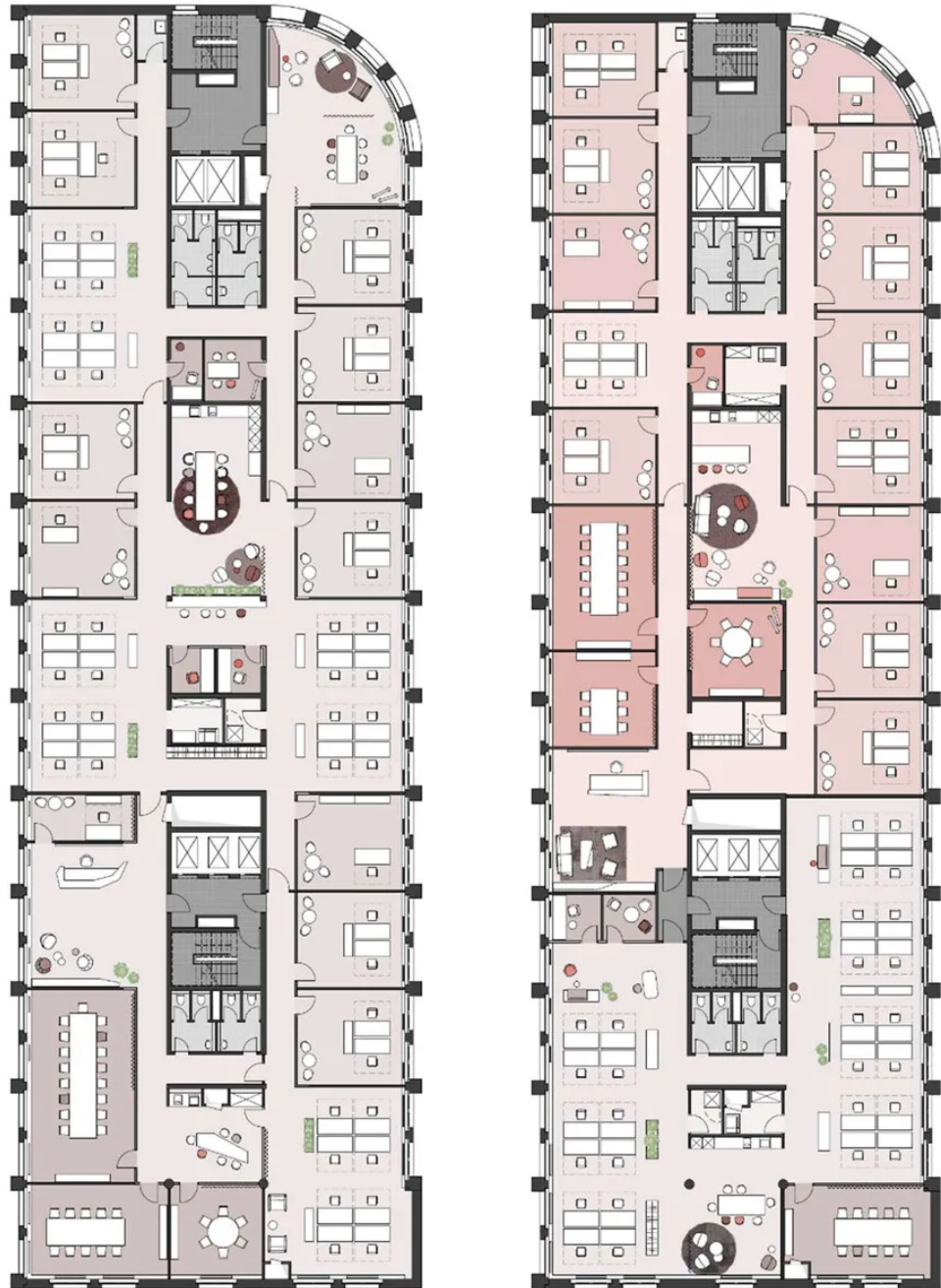
Grundriss beispielhafte Belegungsplanung