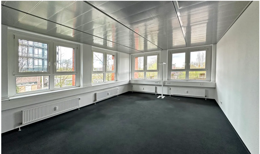
Weitere Ansichten 1. OG