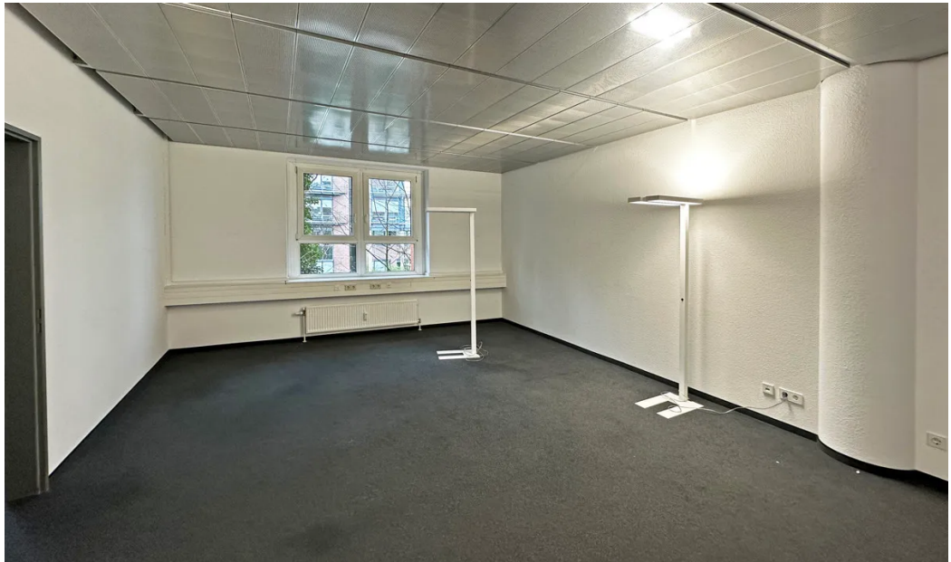
Weitere Ansichten 1. OG