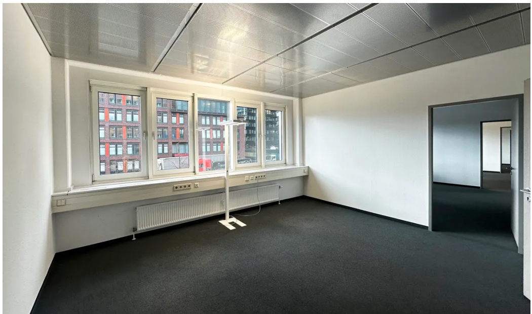
Weitere Ansichten 1. OG