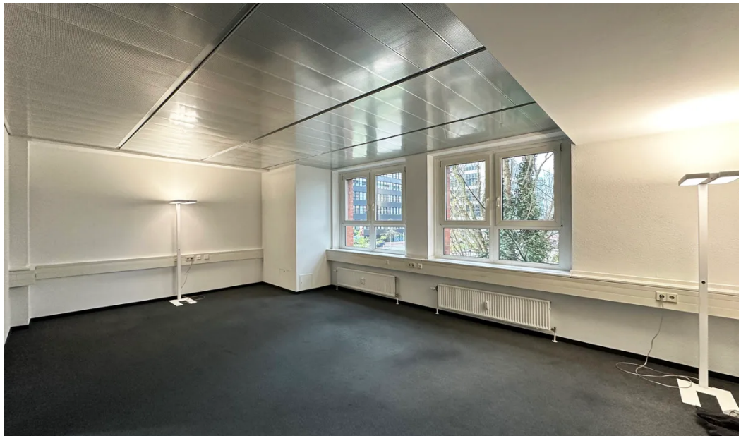
Weitere Ansichten 1. OG