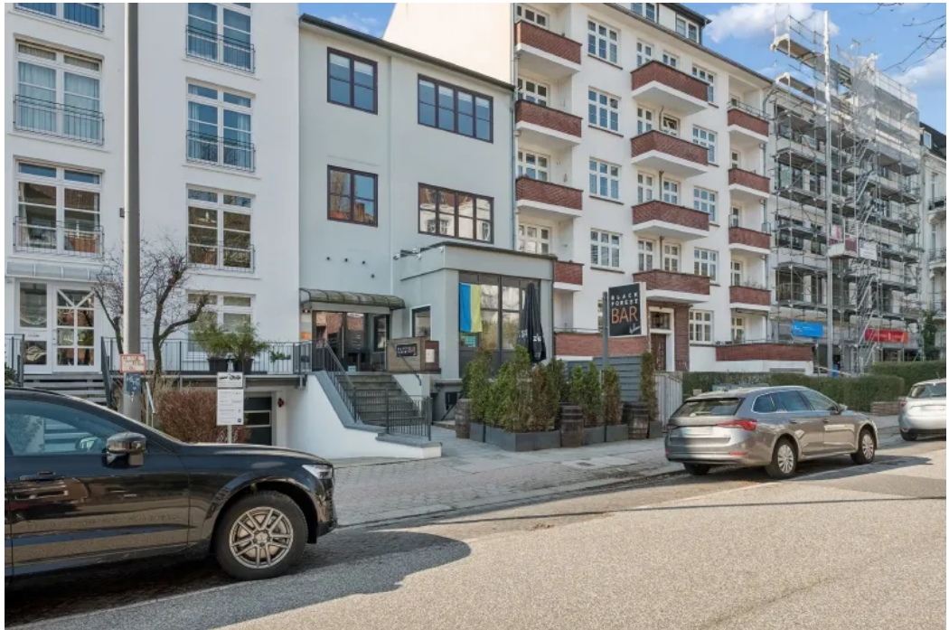
Ansicht Straße links