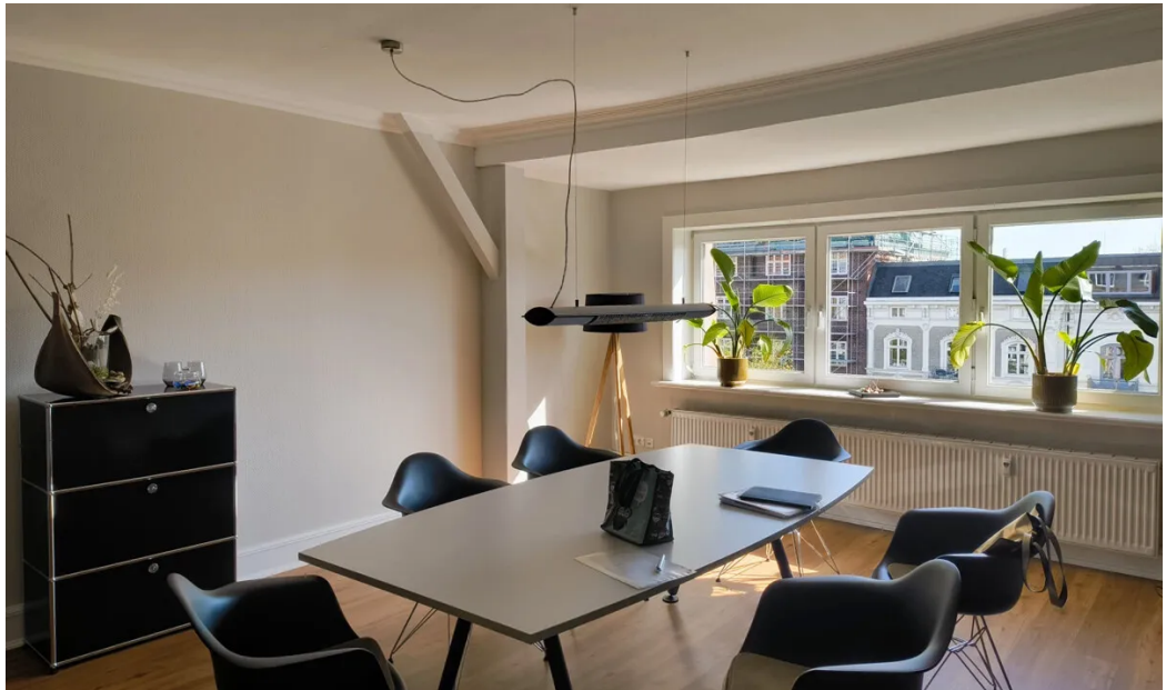
Weitere Ansichten - 4. OG