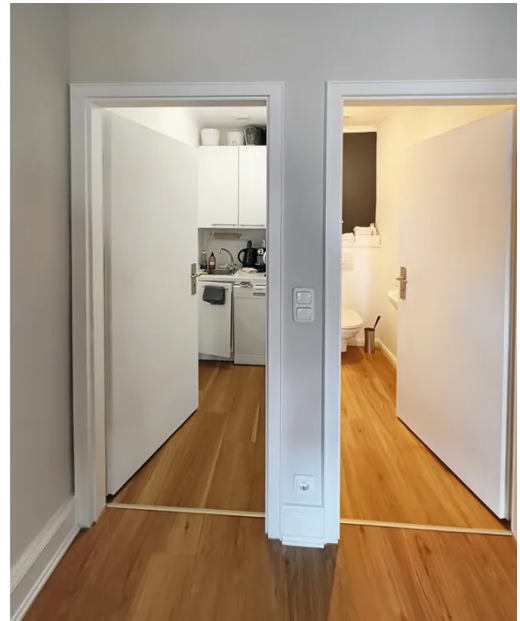
Weitere Ansichten - 4. OG