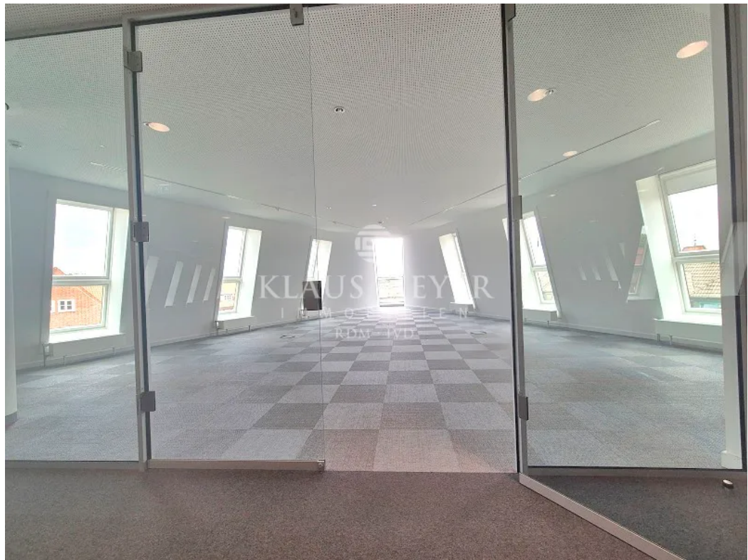
Aufenthalt / Besprechung