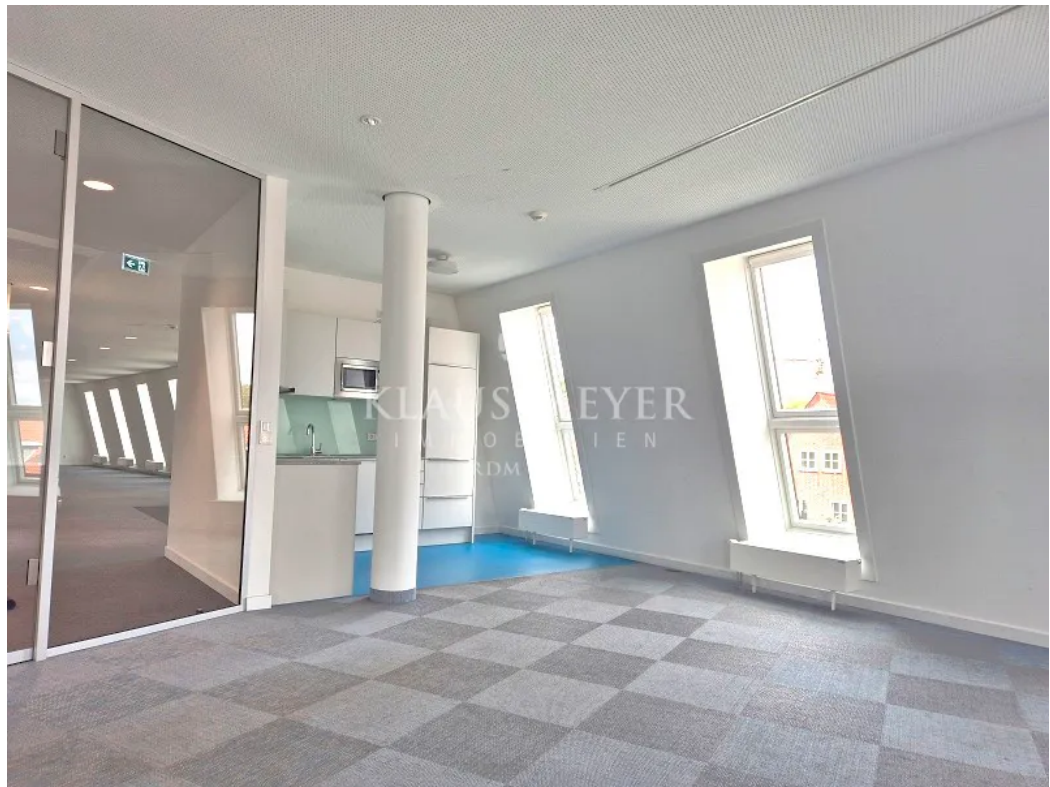
2. Pantry, Aufenthalt