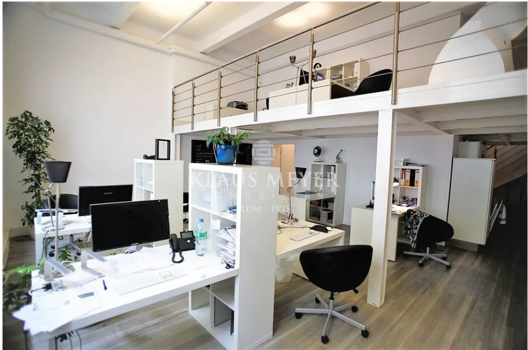
im Büro 145m