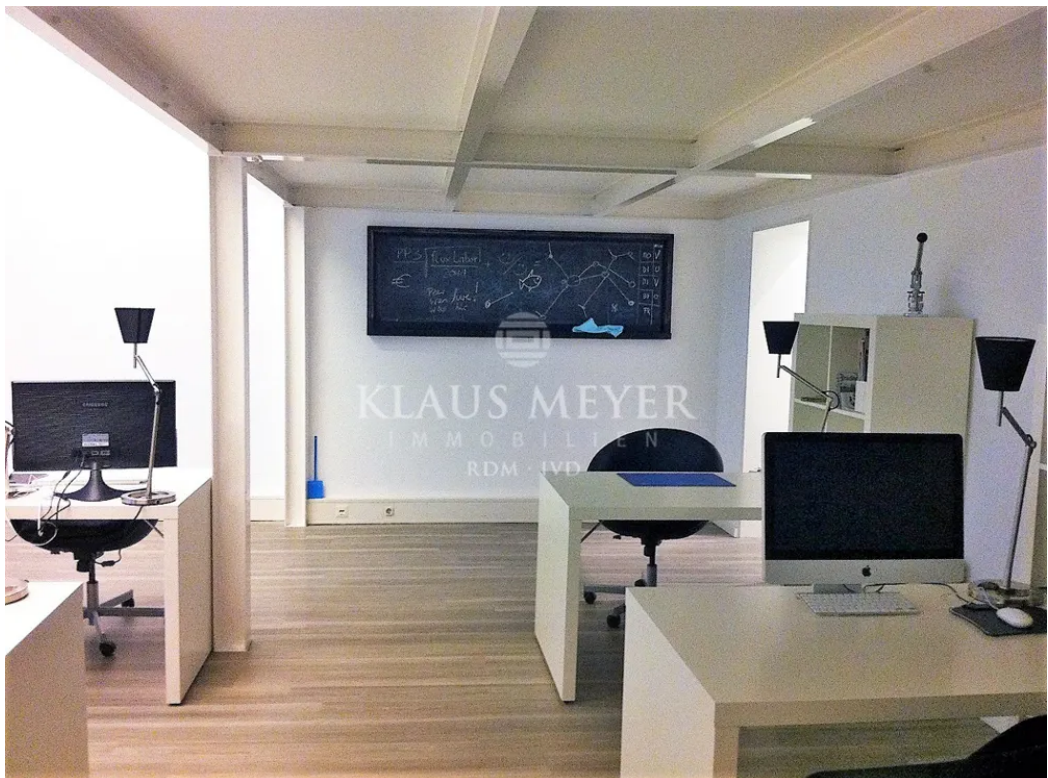
im Büro 145m