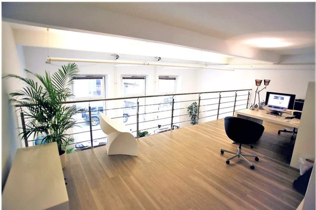
au der Galerie