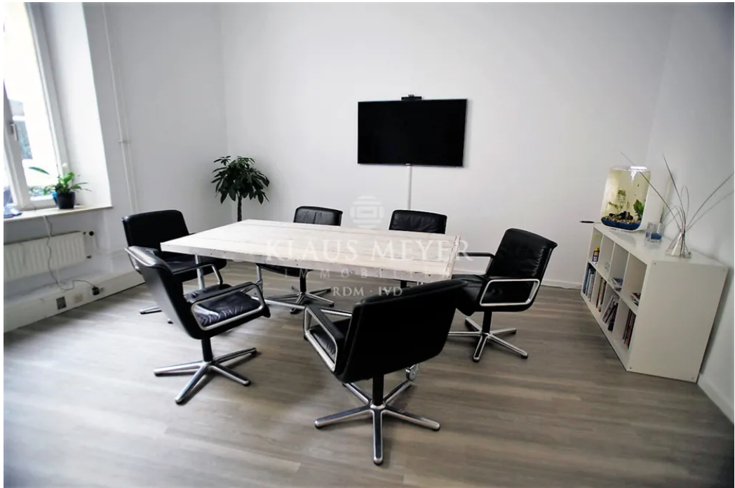
im Büro 145m