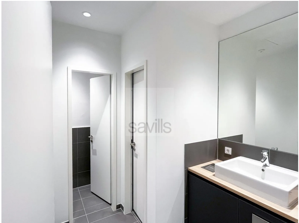
Sanitäranlagen 2. OG