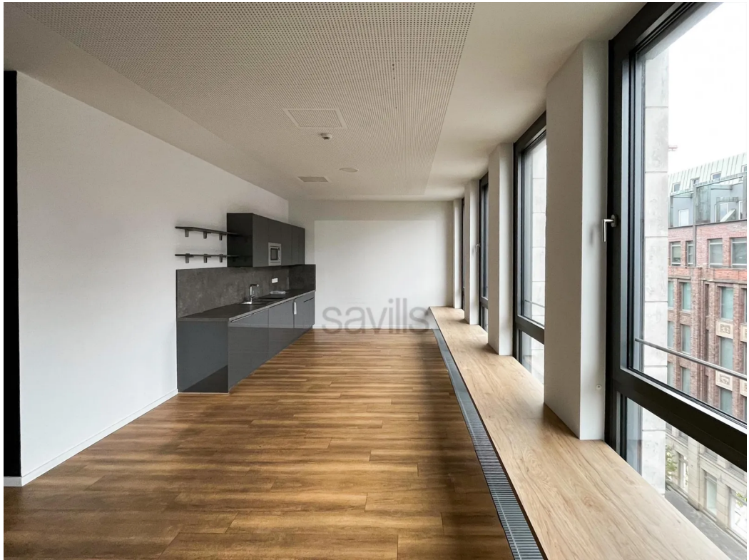
Pantry 5. OG