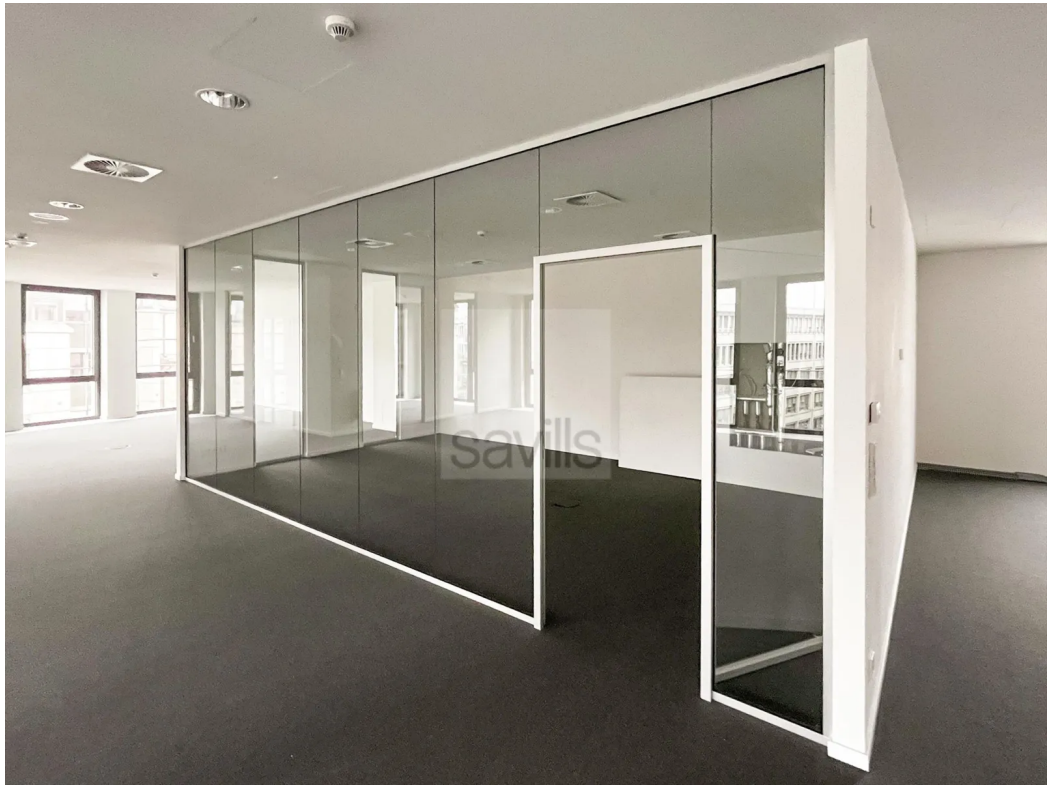
Büro 5. OG