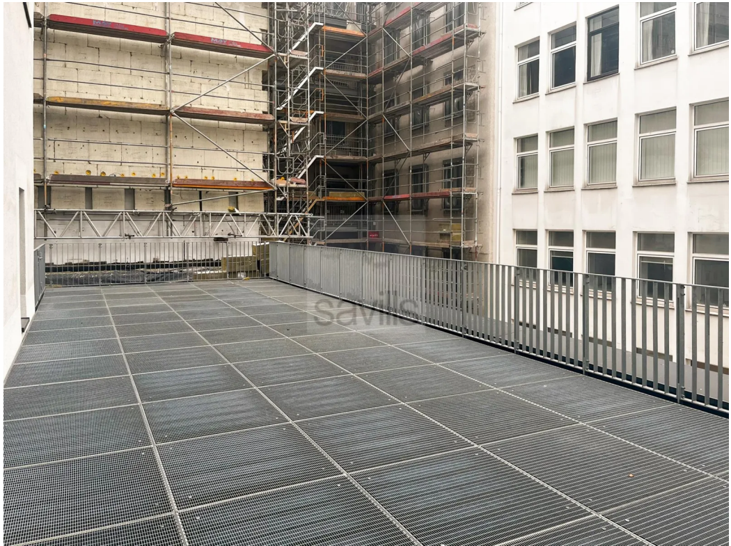
Dachterrasse 2. OG