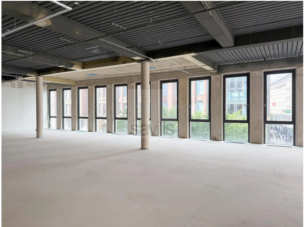
Rohbau 2. OG