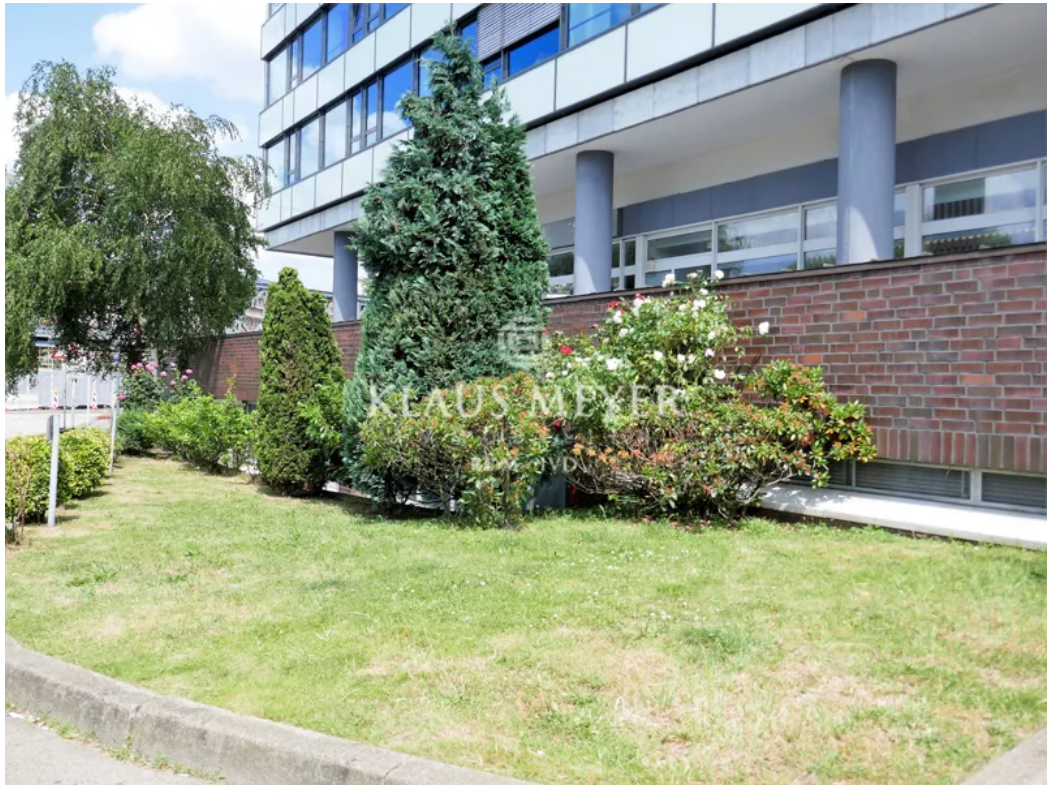
vor dem Gebäude