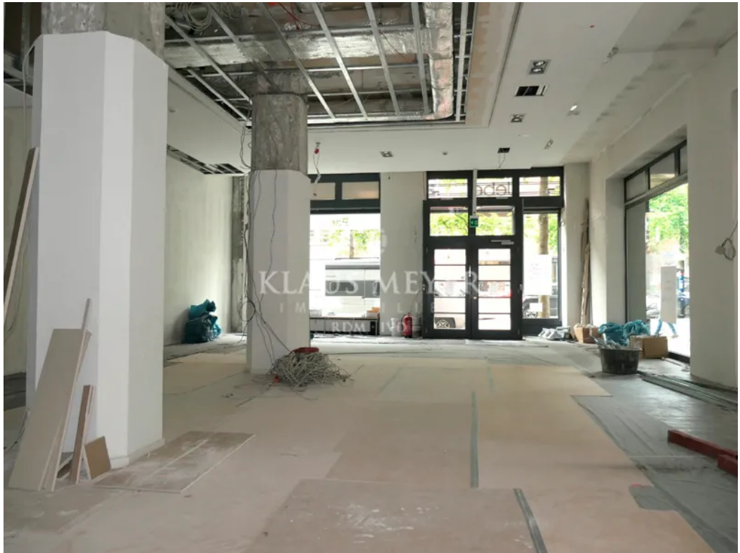
in der Fläche