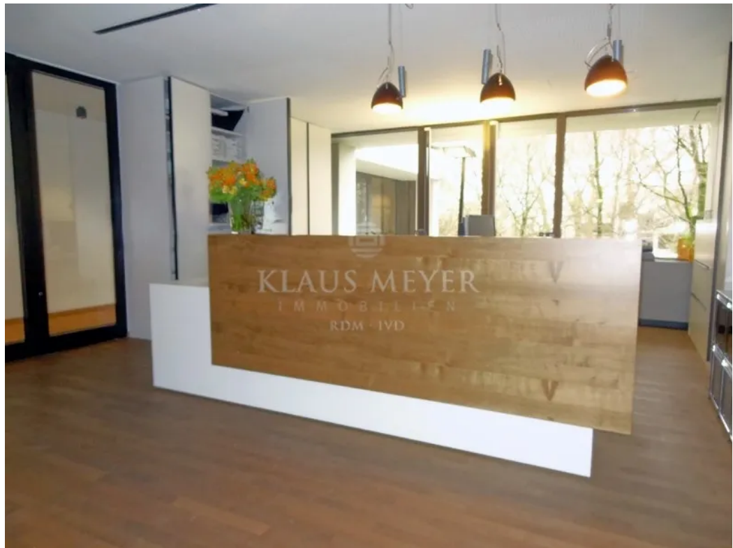
Beispiel aus anderer Etage