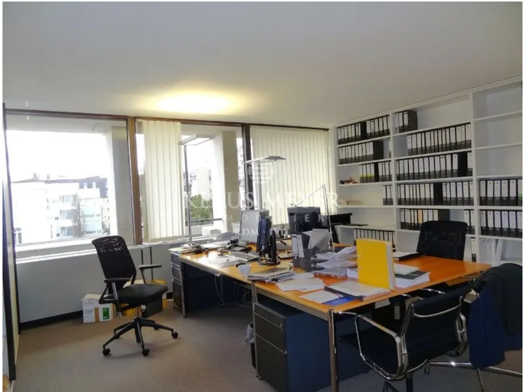
Beispiel aus anderer Etage