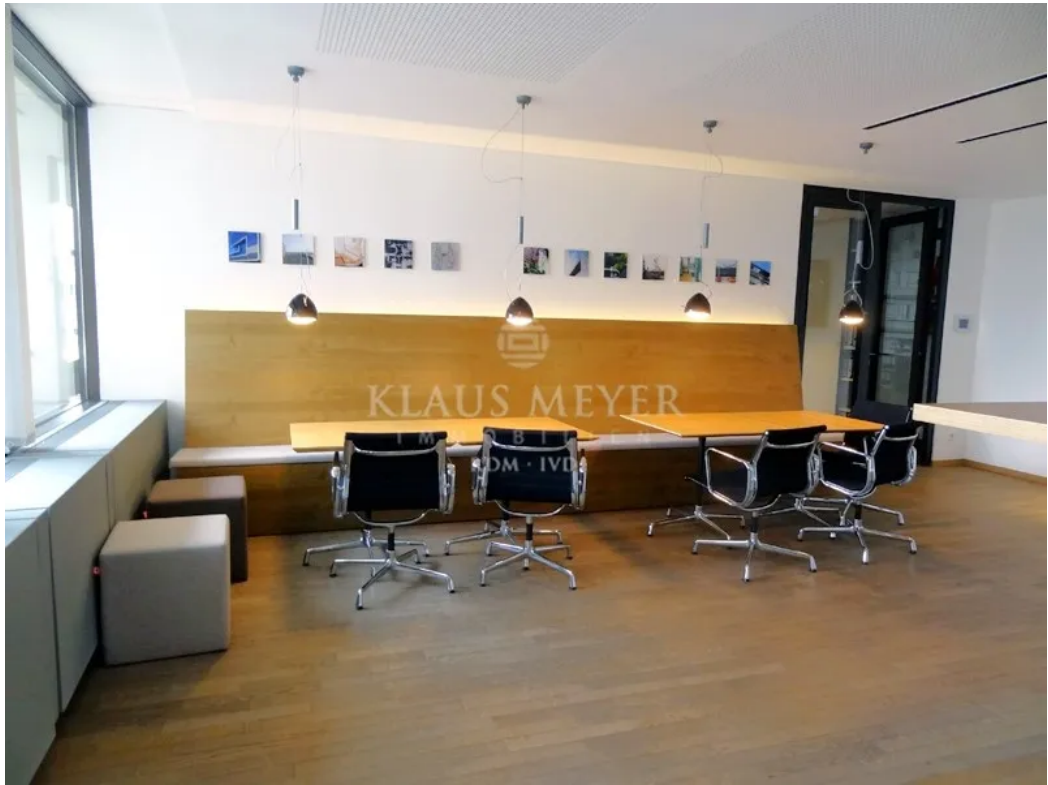
Beispiel aus anderer Etage