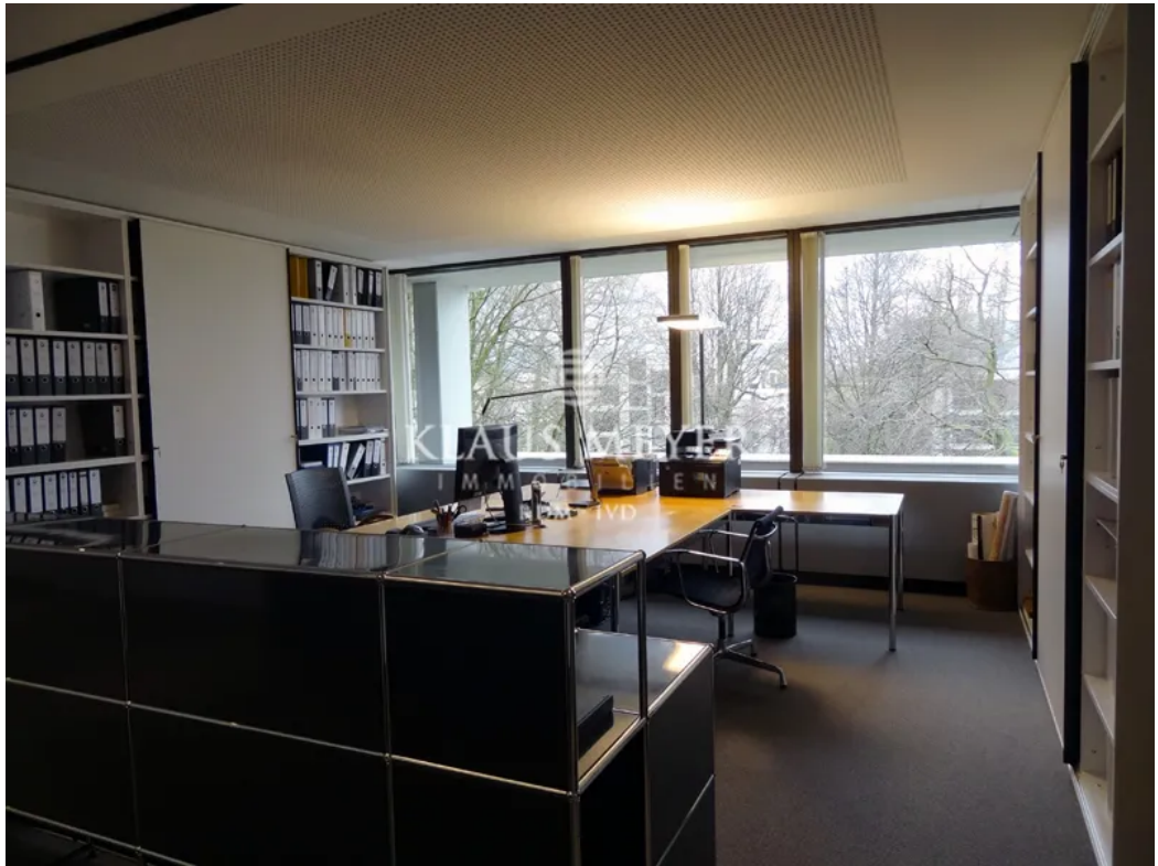
Beispiel aus anderer Etage