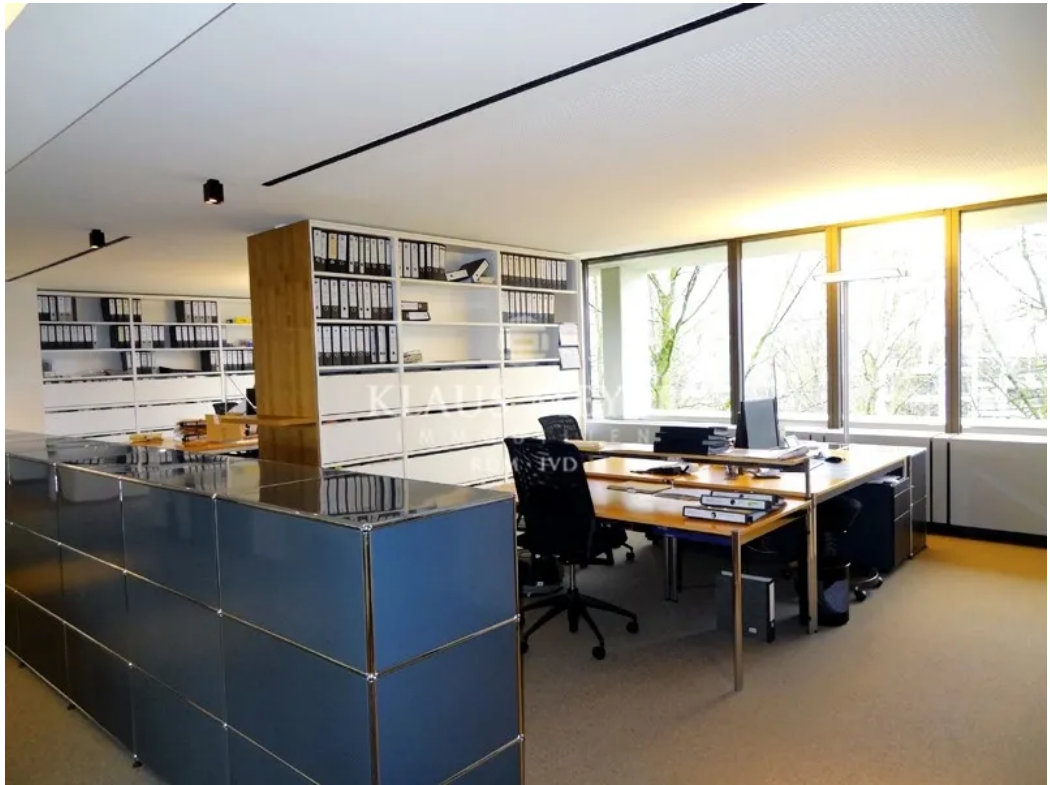
Beispiel aus anderer Etage