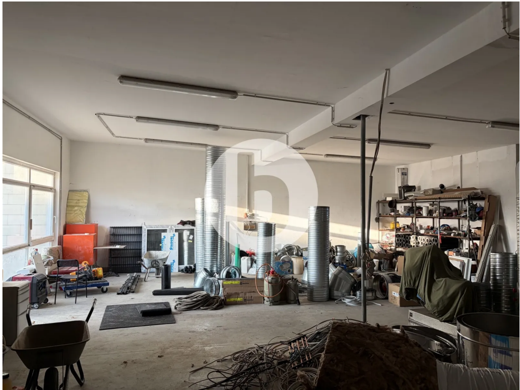
Lager mit ca. 150m 2