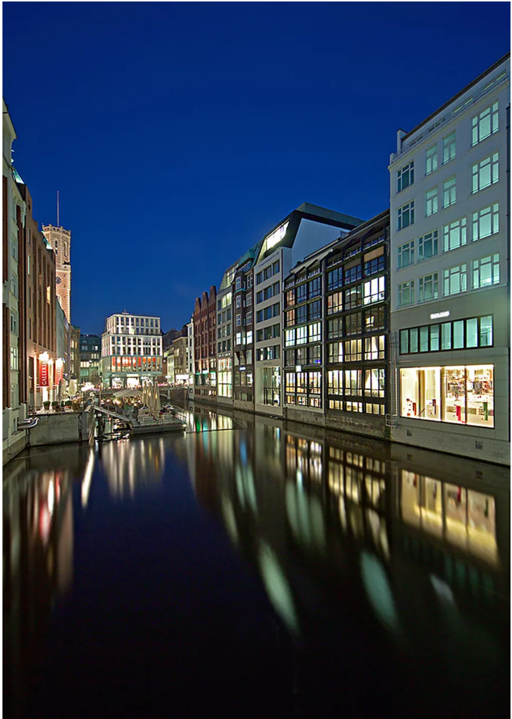
Weitere Ansichten - Fleetseite