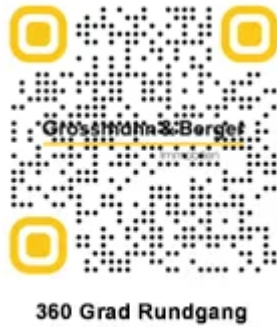
Titelbild klein QR Code