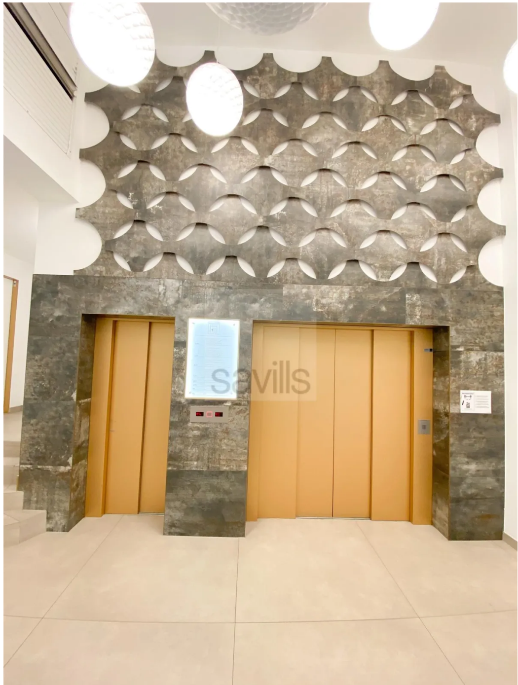
Mönckebergstraße 11-13, Fahrstuhl