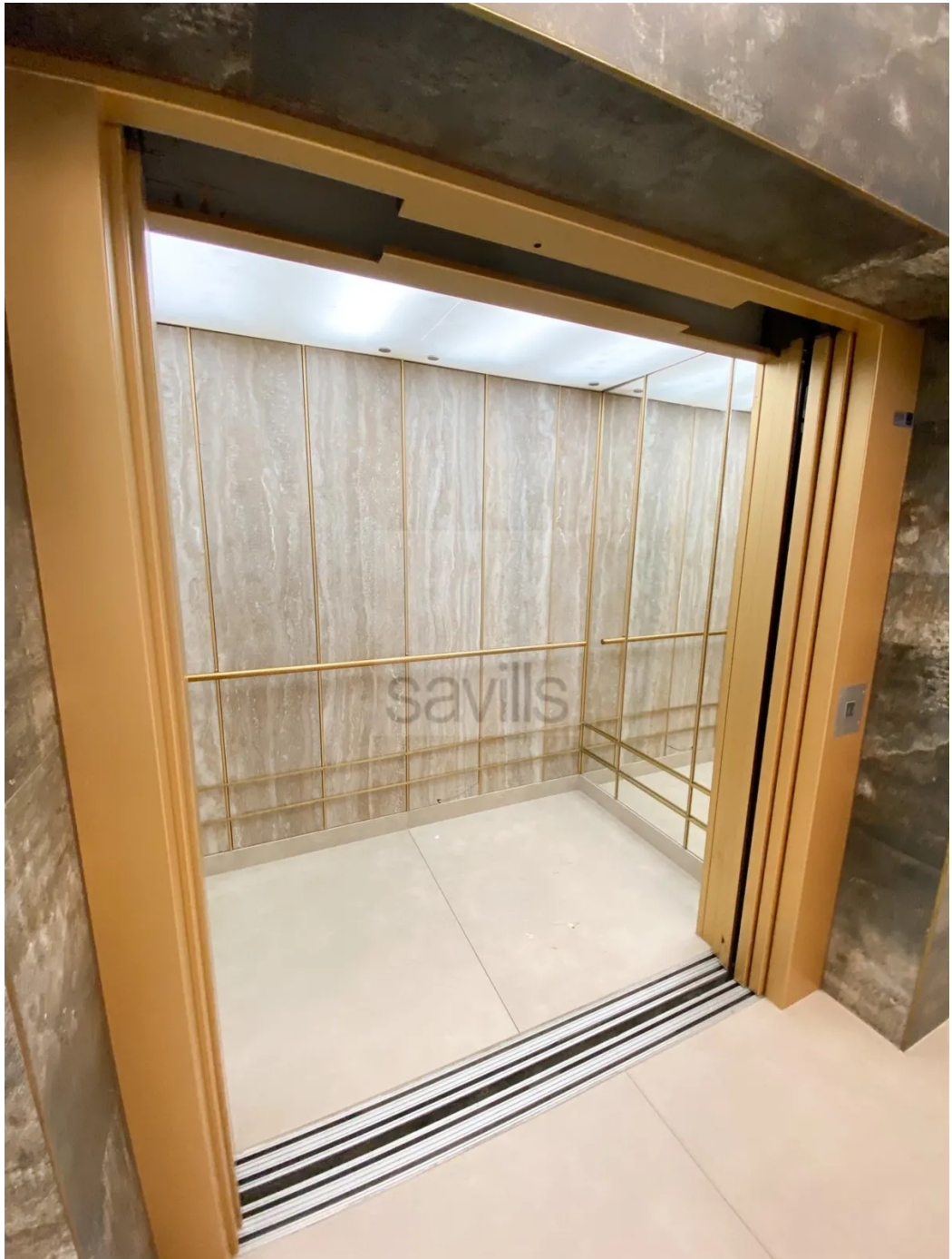
Mönckebergstraße 11-13, Fahrstuhl 2