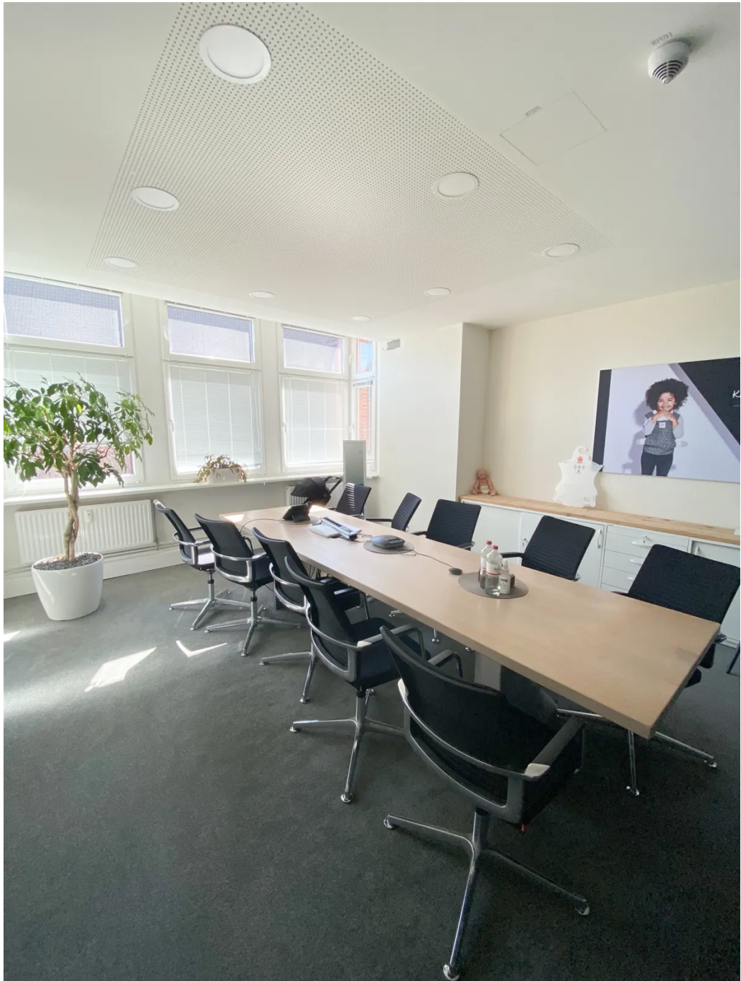
Mönckebergstraße 11-13, Büro