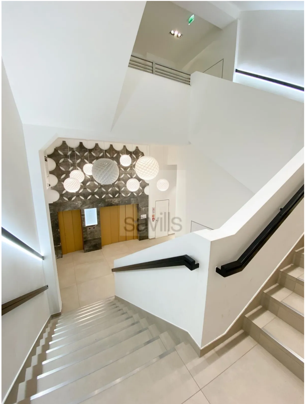
Mönckebergstraße 11-13, Treppenhaus 2