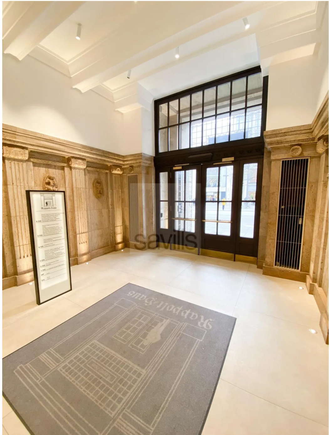
Mönckebergstraße 11-13, Eingangshalle