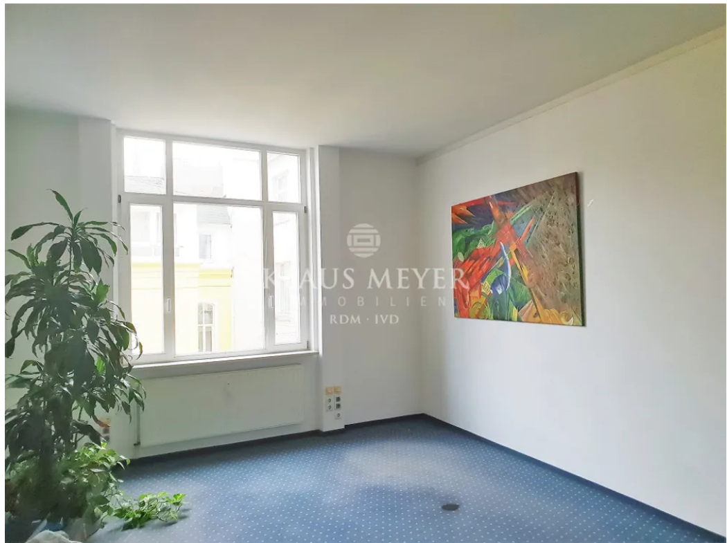
3.OG ca. 403,5 m 2