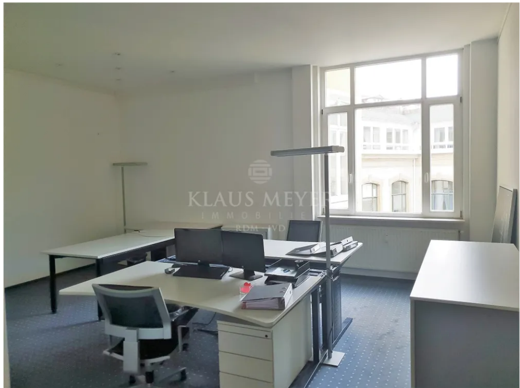
3.OG ca. 403,5 m 2