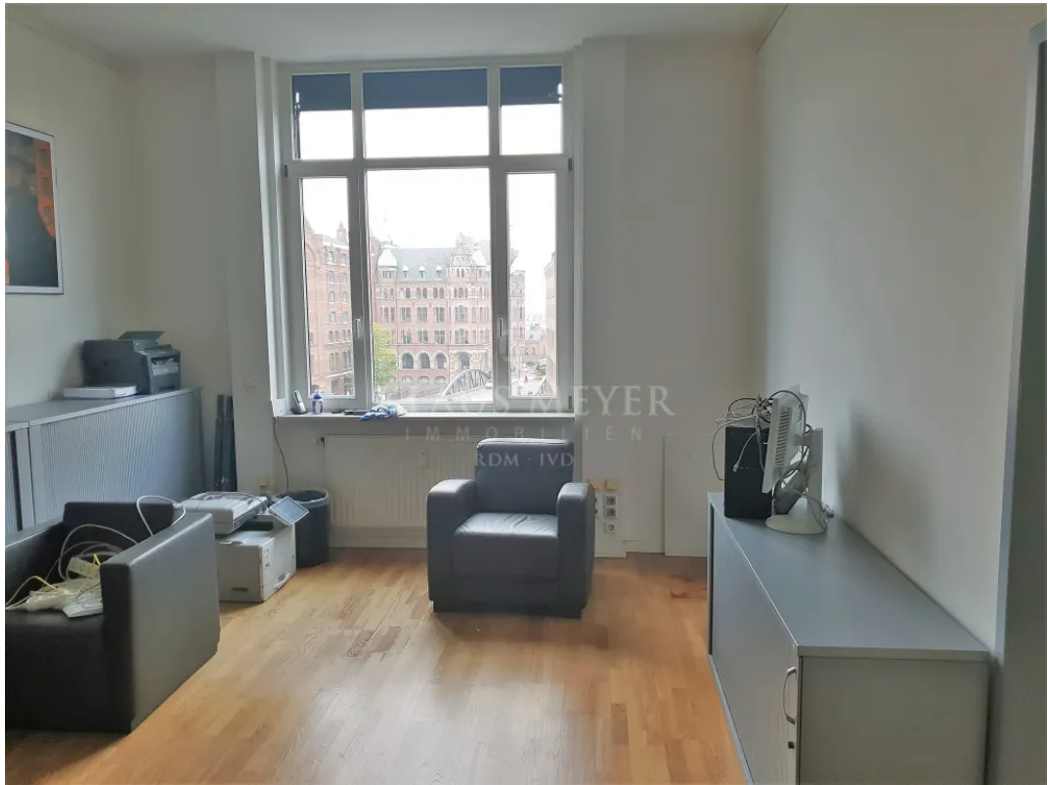
3.OG ca. 403,5 m 2