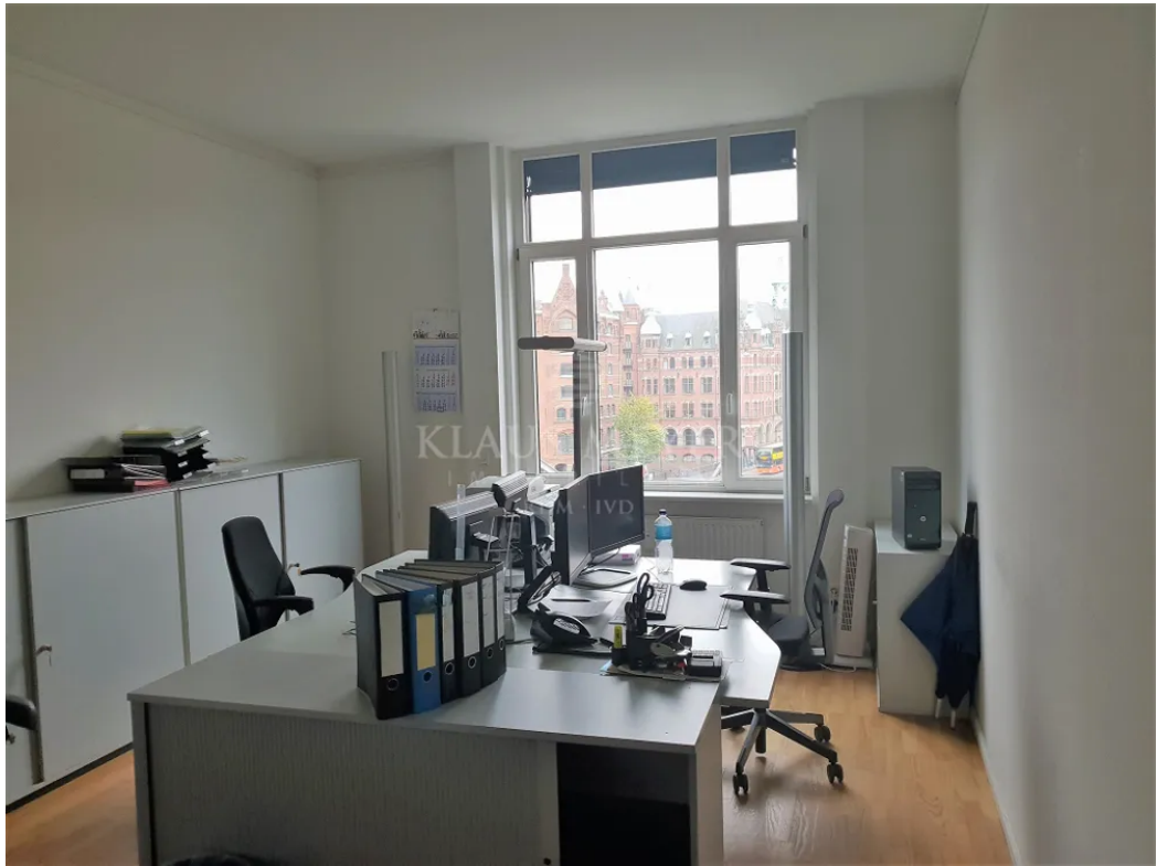
3.OG ca. 403,5 m 2