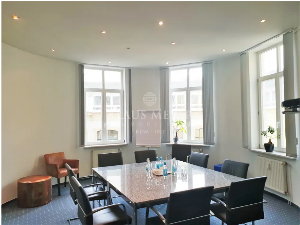
3.OG ca. 403,5 m 2