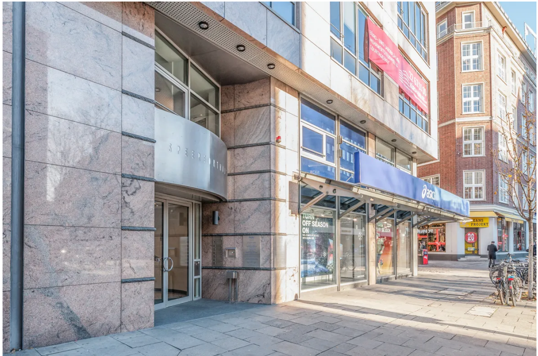
Weitere Ansichten - Büro Außenansicht