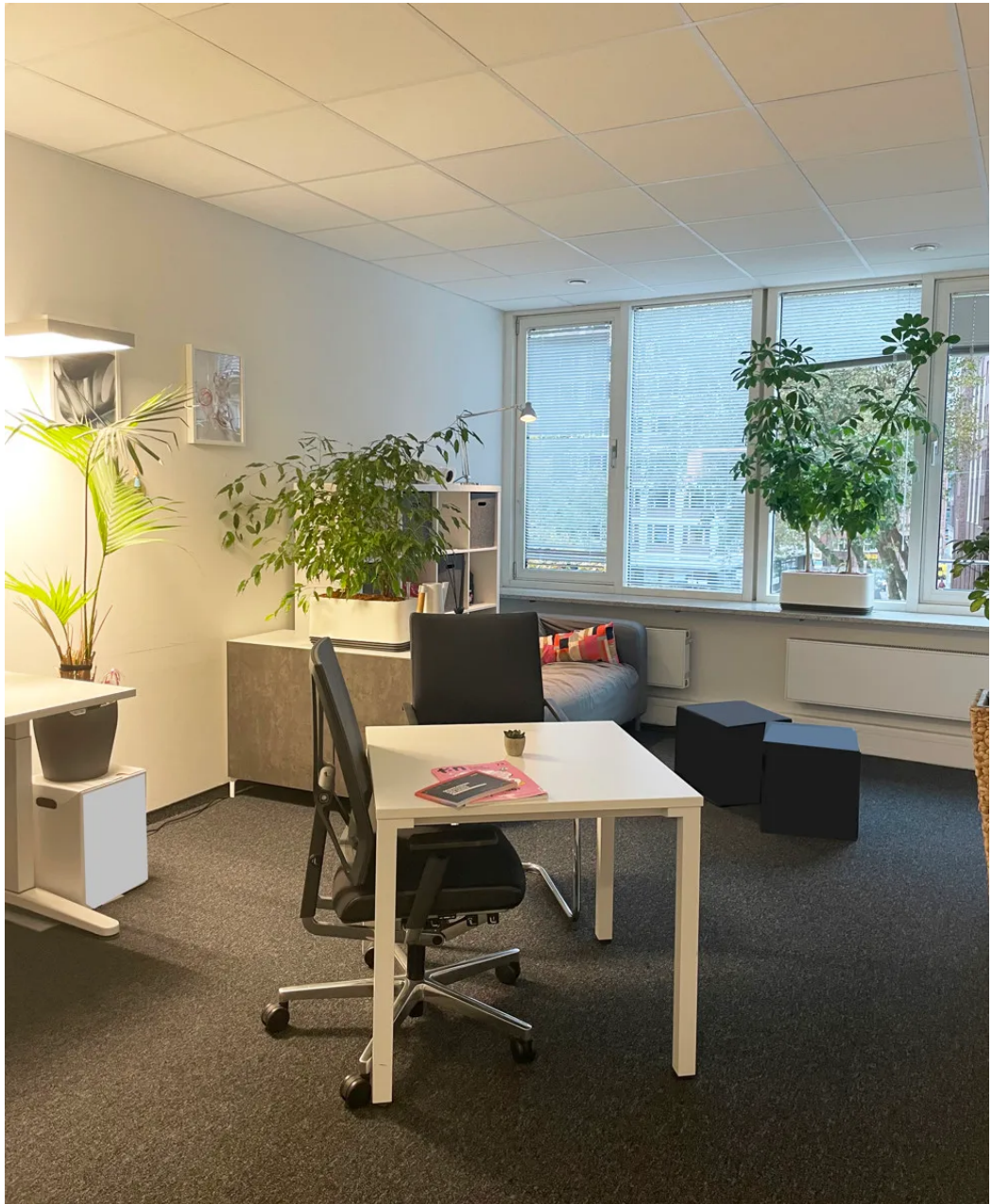
Weitere Ansichten - 2. OG