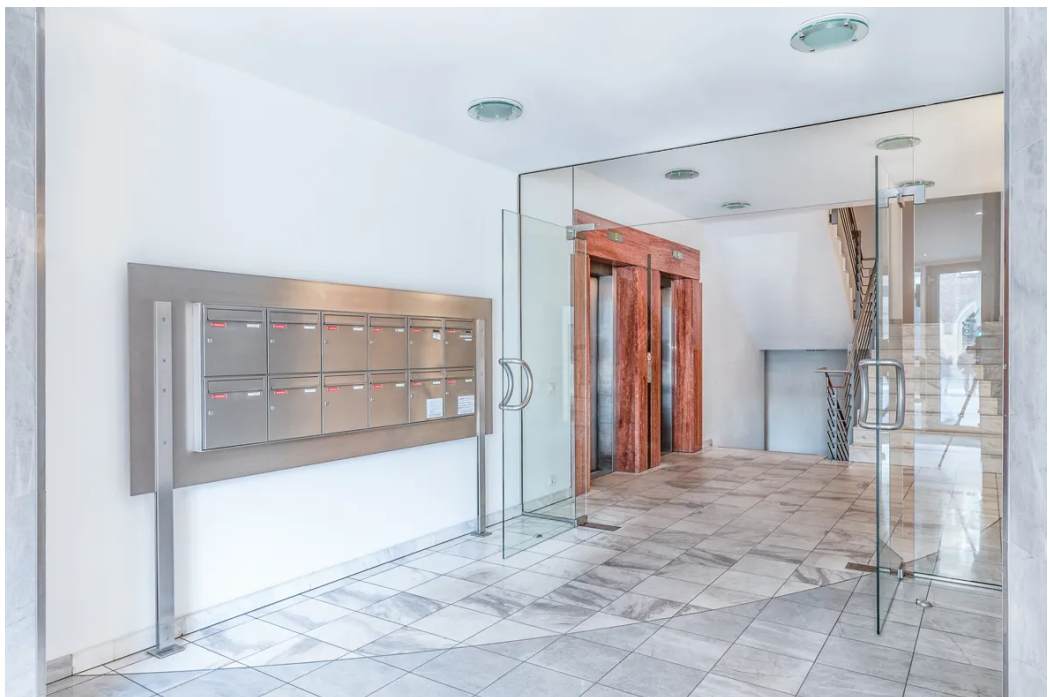
Weitere Ansichten - Büro Eingangsbereich