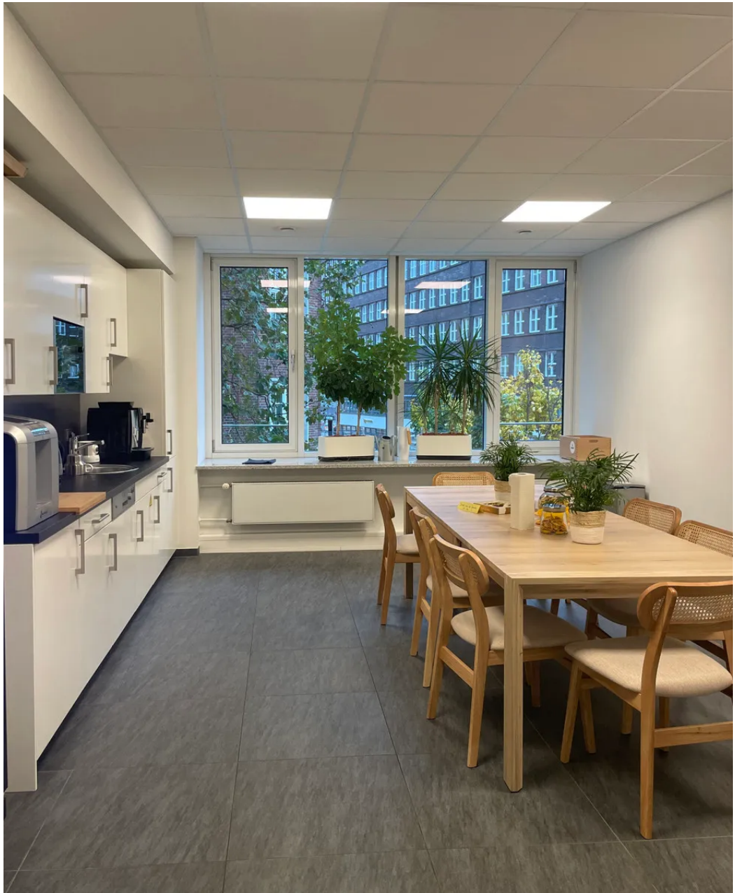
Weitere Ansichten - 2. OG