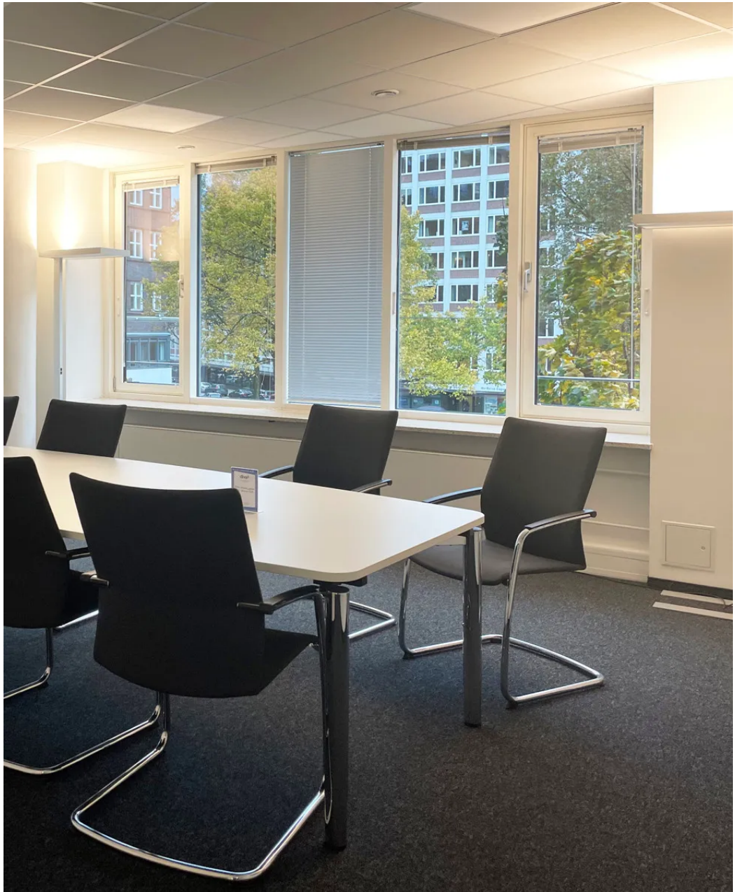
Weitere Ansichten - 2. OG