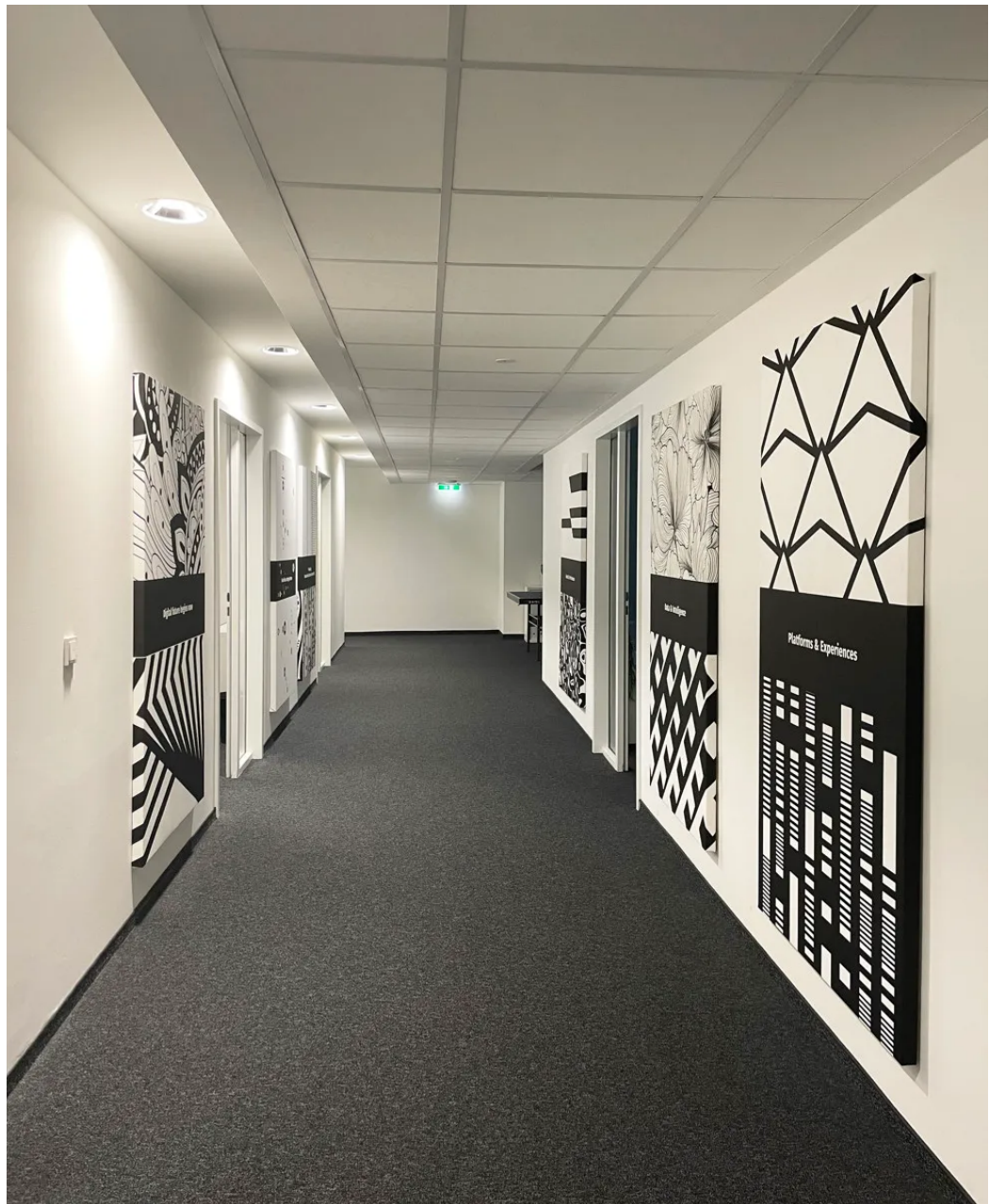
Weitere Ansichten - 2. OG