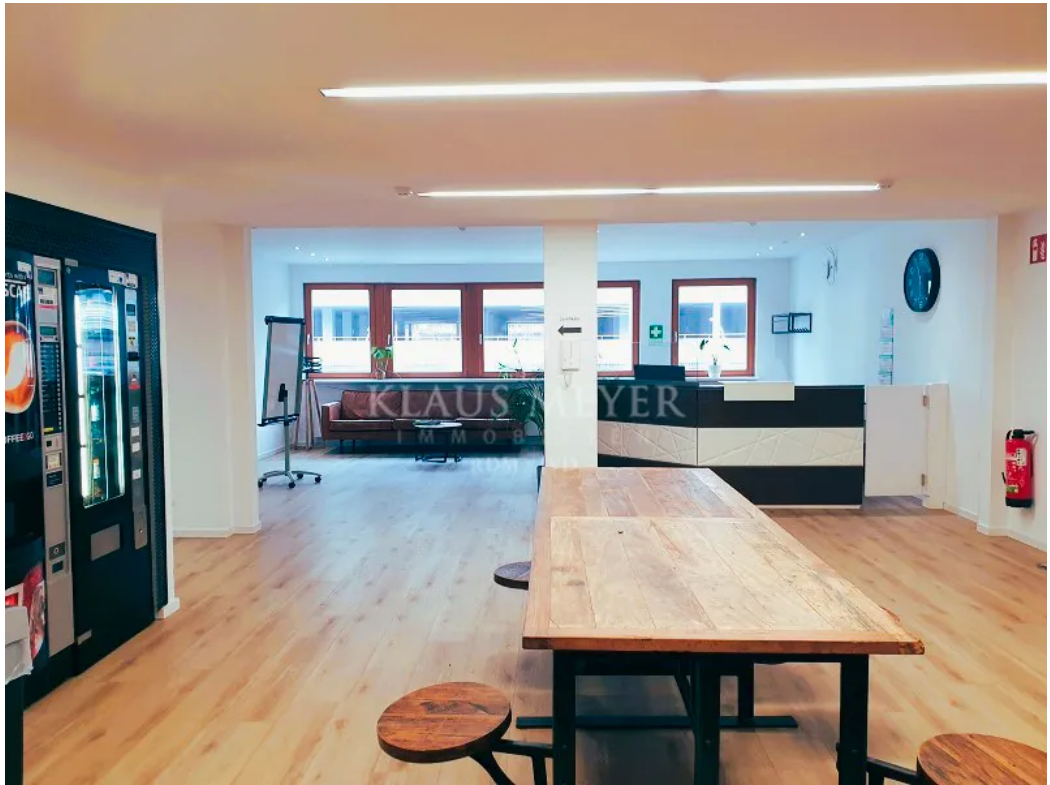
Empfang / Warten / Pause