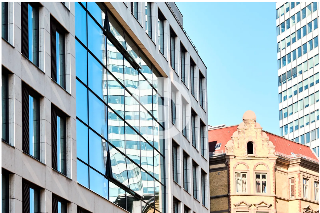
Caffamacherreihe 5-7, 20355 Hamburg BrahmsQuartier - Außenansicht