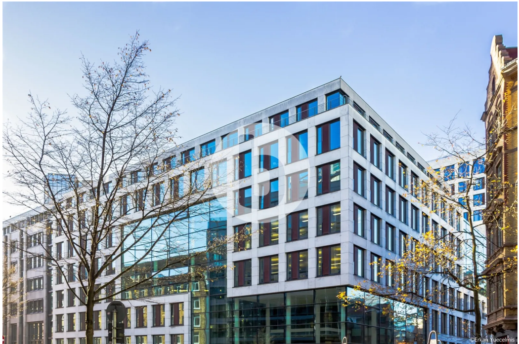
Caffamacherreihe 5-7, 20355 Hamburg BrahmsQuartier - Außenansicht