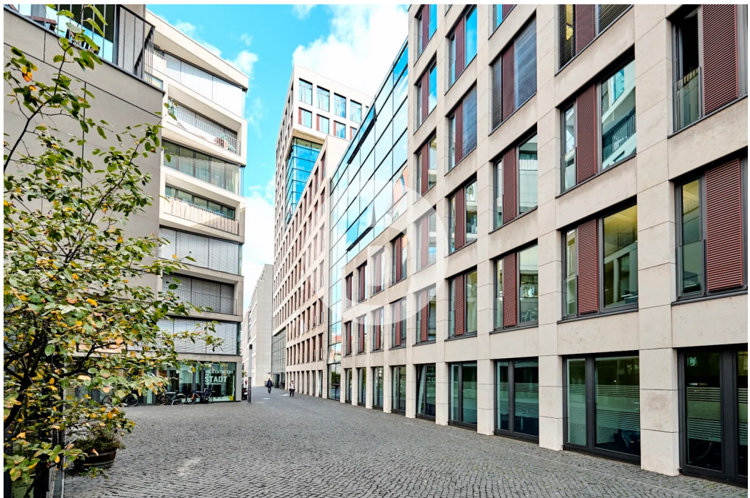
Caffamacherreihe 5-7, 20355 Hamburg BrahmsQuartier - Außenansicht