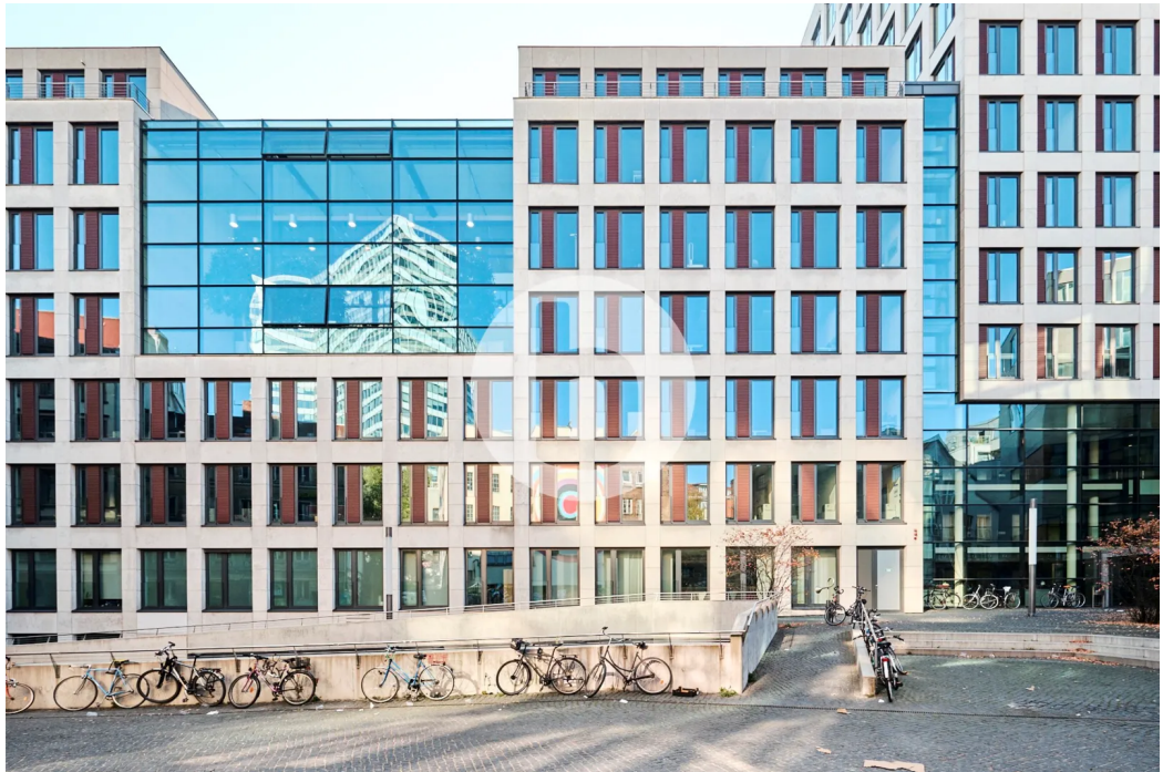
Caffamacherreihe 5-7, 20355 Hamburg BrahmsQuartier - Außenansicht